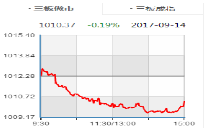
图表2：三板做市指数