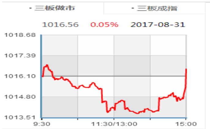
图表4：三板做市指数