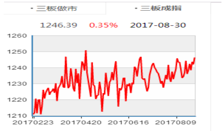
图表5：三板成分指数