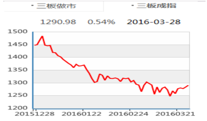
图表2： 新三板成分指数