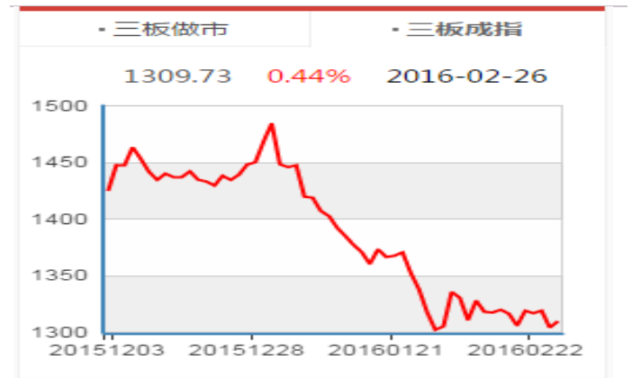
图表2： 新三板成分指数