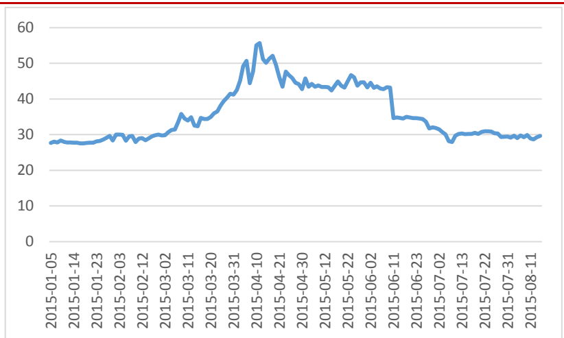
图表 11：新三板整体估值水平变化