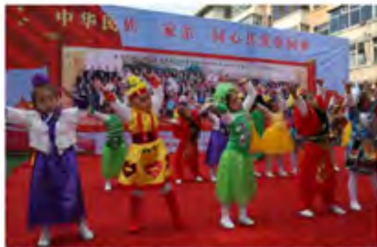
小朋友们表演的舞蹈《中华民族一家亲 同心共筑中国梦》博得观众们热烈的掌声