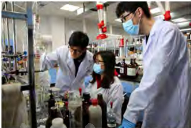
延边大学教学设施完善，实验室设备一流，图为药物合成实验室