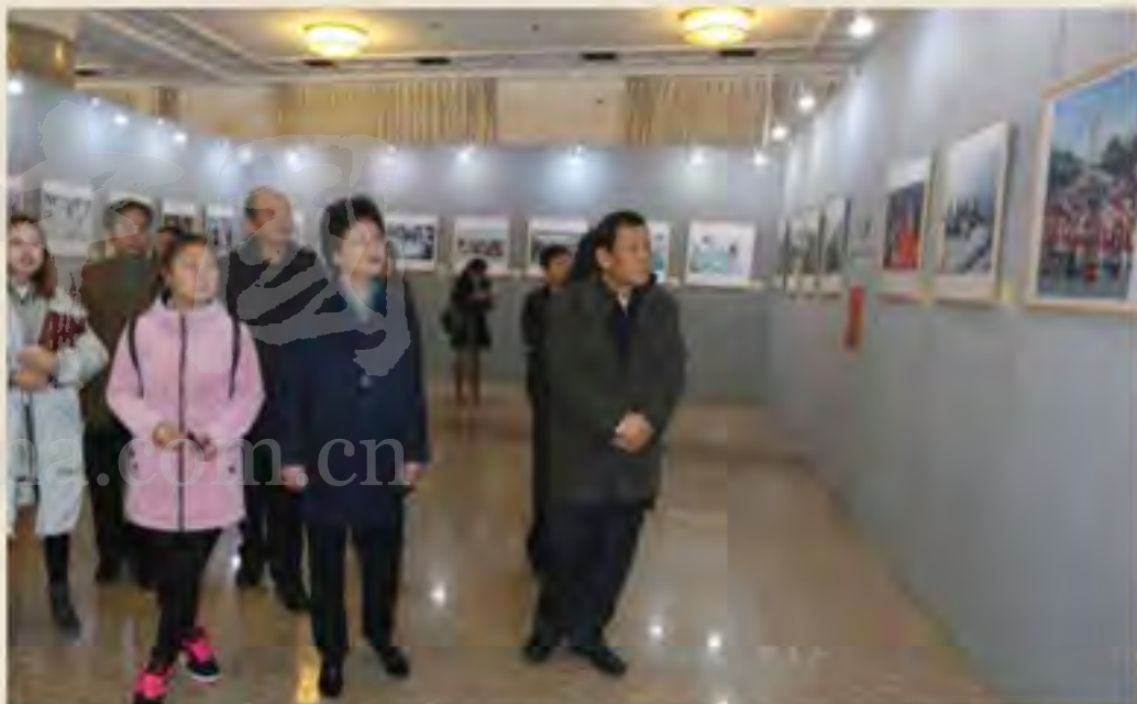
▲2016年12月20日上午，国家民委“脱贫攻坚——家风建设在行动”摄影展在北京民族文化宫开幕。摄影展由国家民委直属机关党委、直属机关工会主办，民族出版社、民族文化宫承办，中央国家机关工委副书记陈伟，国家民委党组副书记、副主任刘慧，全国妇联宣传部部长董小健，中央国家机关工委纪检（群工）部部长冯伟出席开幕式。此次摄影展是贯彻落实习近平总书记关于家风建设重要指示精神，扎实推进“两学一做”学习教育的创新举措。摄影展共展出摄影作品100余件，分为重要指引、和谐家园、幸福家庭三个部分，突出展示党中央对少数民族群众的牵挂关爱，展示民族工作者心系各族群众、关心各族群众、帮助各族群众的情怀，展示各族干部职工家庭的温馨、美满、幸福。