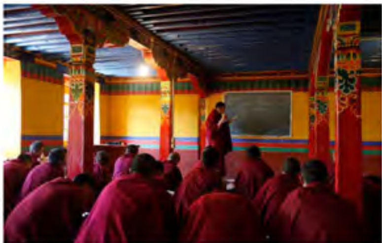
西藏佛学院甘丹寺分院的僧人在上早课