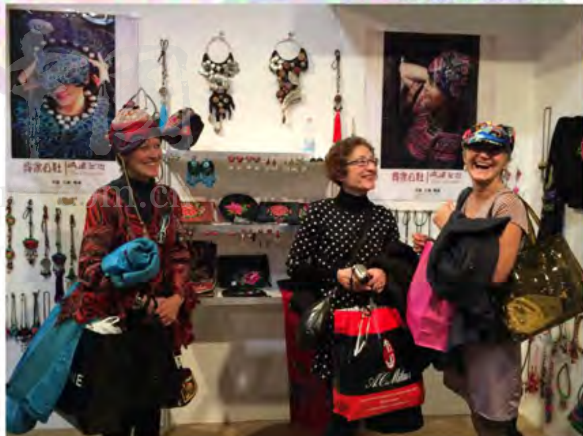
绣坊产品到意大利米兰国际手工艺品博览会参展