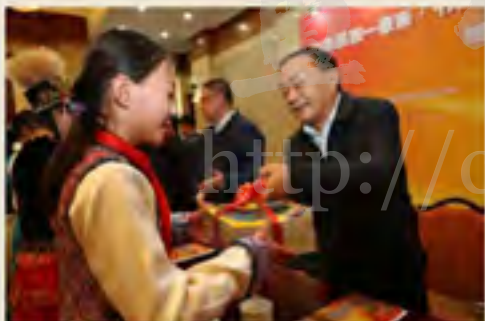
▲2016年12月2日，由国家民委和共青团中央主办、民族出版社承办的“中华民族一家亲，手牵心连——带本书给留守儿童”赠书仪式在国家民委多功能厅举行。国家民委副主任李磊，共青团中央书记处书记徐平，国家新闻出版广电总局出版管理处副司长李一，民族出版社社长王世堂等出席了活动。此次活动向新疆、内蒙古、西藏、辽宁、吉林、黑龙江等省区的部分中小学、幼儿园留守儿童捐赠图书、纸、铅笔、橡皮、蜡笔等民族文具及汉字启蒙少年读物，总捐赠量达350万元。