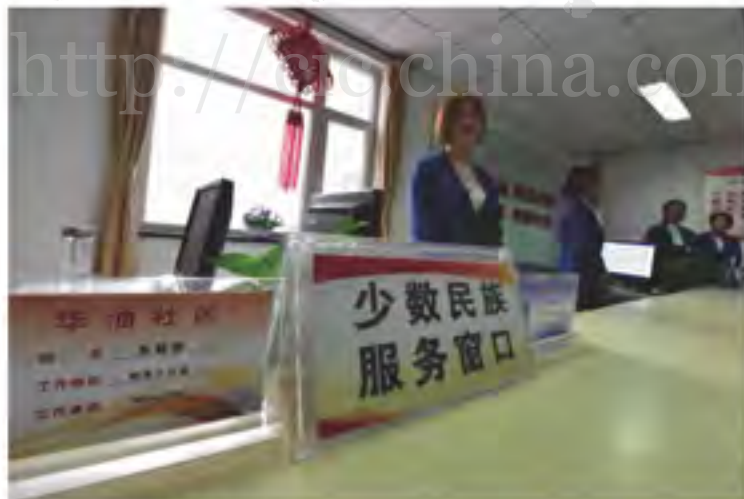
华油社区特有的少数民族服务窗口