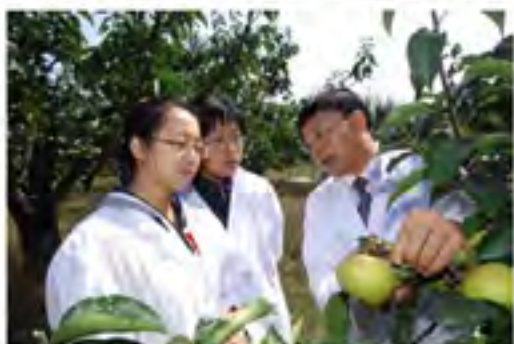
在果园里，农学院研究生导师给学生讲苹果种植技术