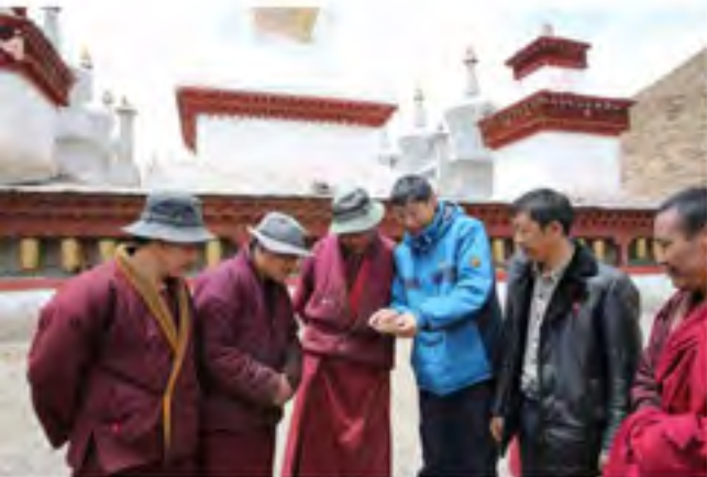
那曲地区比如县向各寺院僧人发放县委领导的电话号码