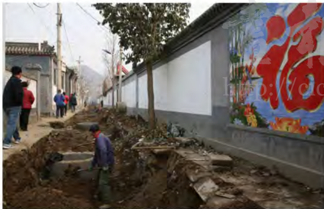
凤凰台村的地下管线建设正在加紧进行，但来村里体验满家乐的人一点不见少

苏老爷子在凤凰台村开了一家“老苏满家乐”，在村里口碑甚好，不少游客也是慕名而来。我们拜访苏老爷子的时候，他正在切鹿尾(yi)儿。“这鹿尾儿得倒切，你看，像儿光。正切容易把它(馅)挤出来，因为太松了。”提起满族饮食，苏老爷子打开了自己的话匣子。“这鹿尾儿之所以这么叫，是因为皇上吃那会儿，是鹿尾巴当外皮，(食材)里边借儿状，一推出血那种，才能给皇上吃，皇上吃的也就只能一盒，大臣们是不跟着吃的。”“你尝尝这松花小肚，虽然是凉食，吃完了不扎胃。我这