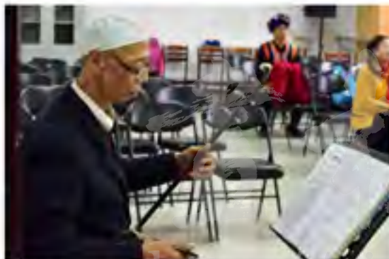
老年艺术团合唱民族传统歌曲，一位苗族老人正在拉二胡