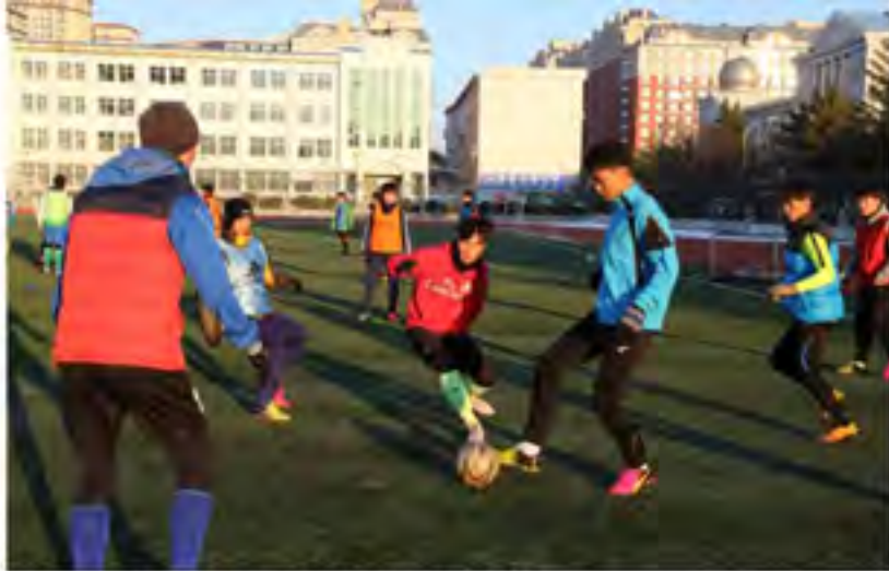
足球运动在延边一中非常普及，这富有鲜明的校园足球文化传统