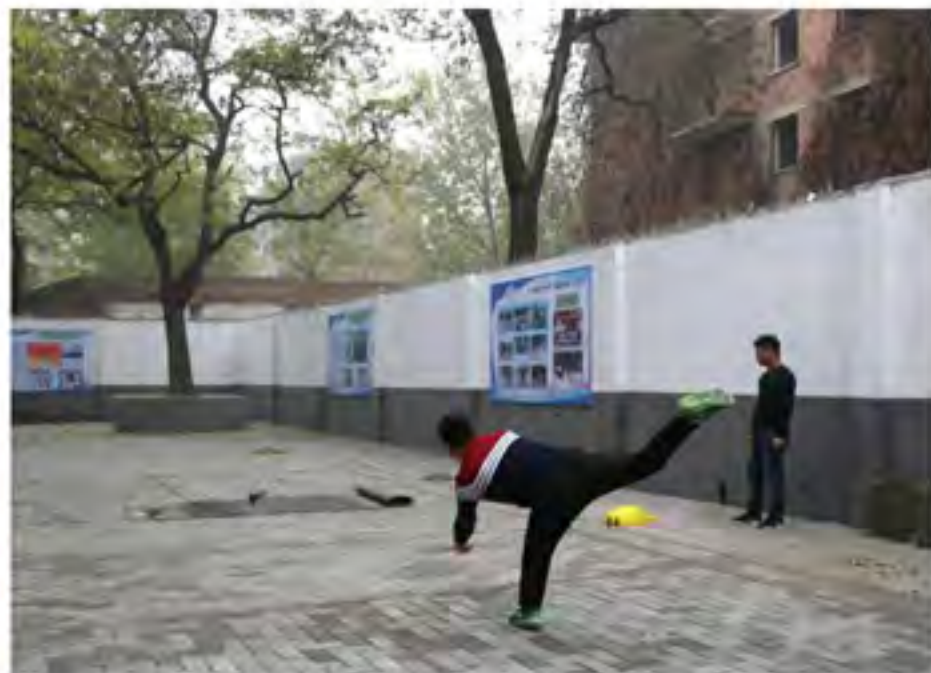
陀螺运动员“大展身手” 守方教练陀螺，击成方将自己的陀螺抽离，击打守方陀螺

经过热闹非凡的河北省保定市中心城区，我们乘车去探访保定市回民中学。保定市的著名景点“一亩泉”在车窗外一闪而过，我们正感叹保定市文化底蕴的深厚，司机师傅告诉我们：“回中到了。”下了车，就看到保定市回民中学简朴的校门。