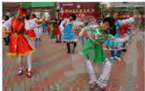
沧州市运河区国民小学的学生在课内跳起学校汇编的民族韵律操