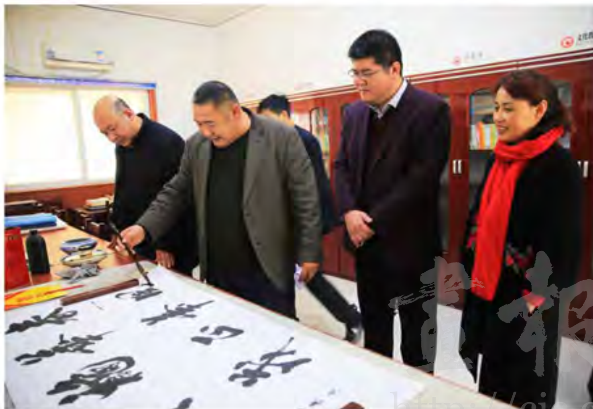
刘皮庄村老年活动中心

刘皮庄是河北省黄骅市羊三木回族乡的一个传统村落，南邻南排河，北接城北城市工业园区，东倚贯穿黄骅市全境的205国道，发达的交通，得天独厚的地理位置使之成为宜农宜工、宜商宜居的宝地。刘皮庄村形成于明朝永乐年间，至今已有600多年历史，现有村民1400多人，其中回族人口占一半以上，是一个典型的回汉杂居的村落。生活在这里的回汉群众，相互尊重传统文化与生活习俗、和谐相处，长期以来亲如兄弟，携手共建美丽家园，成为远近闻名的文明村。2014年，被河北省民族宗教事务厅确定为省级少数民族特色村寨。