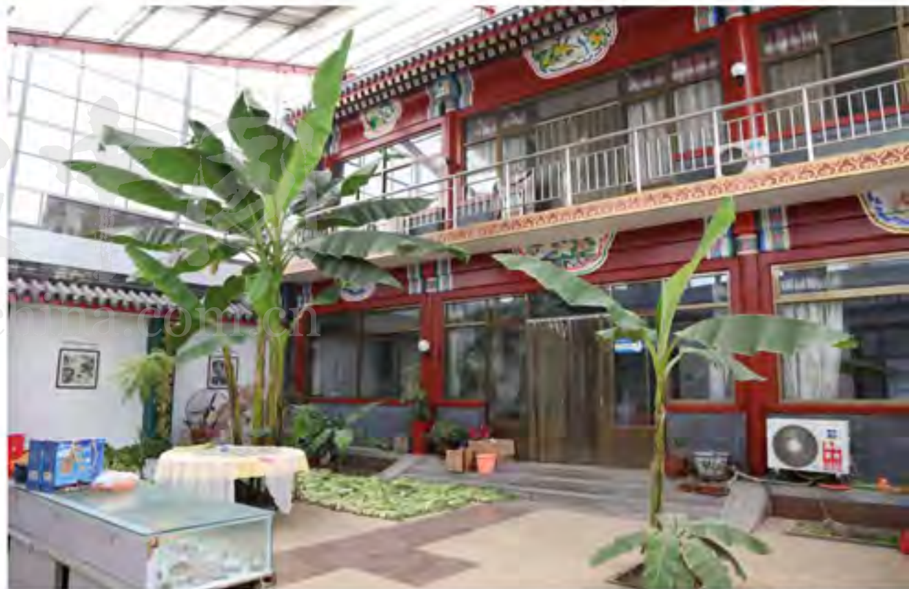
每个满家乐小院都各有特色,都让人倍感温馨