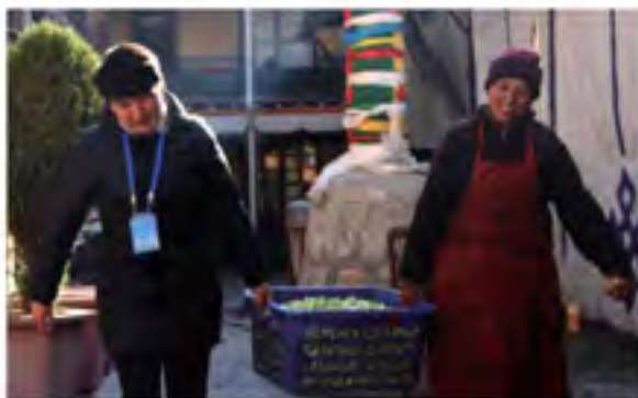
驻寺干部与僧尼一起劳动