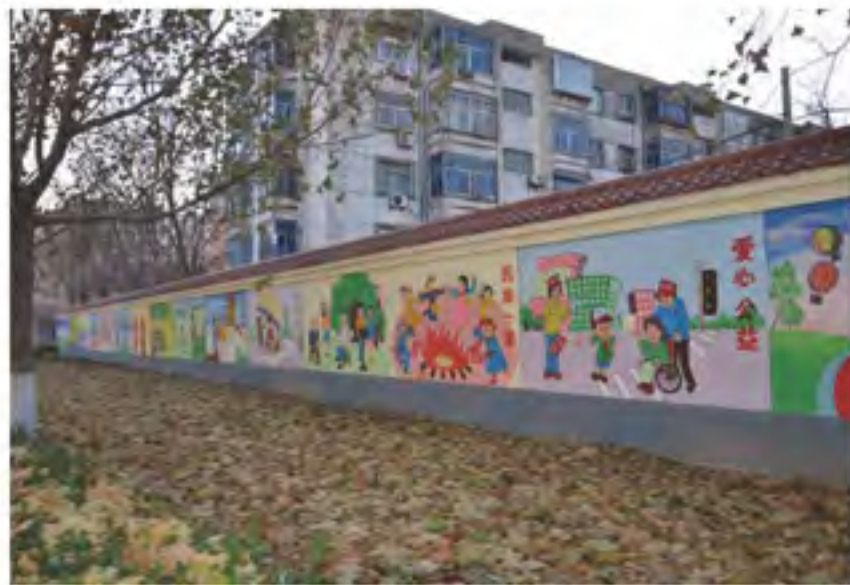
社区里的彩绘文化墙

“五十六个民族五十六枝花，五十六个兄弟姐妹是一家，五十六种语言汇成一句话，爱我中华爱我中华爱我中华……”未踏进华油社区的办公楼，社区居民嘹亮的歌声就从三楼的排练室里传来。此时，老年艺术合唱团的成员们正在排练歌曲《爱我中华》。