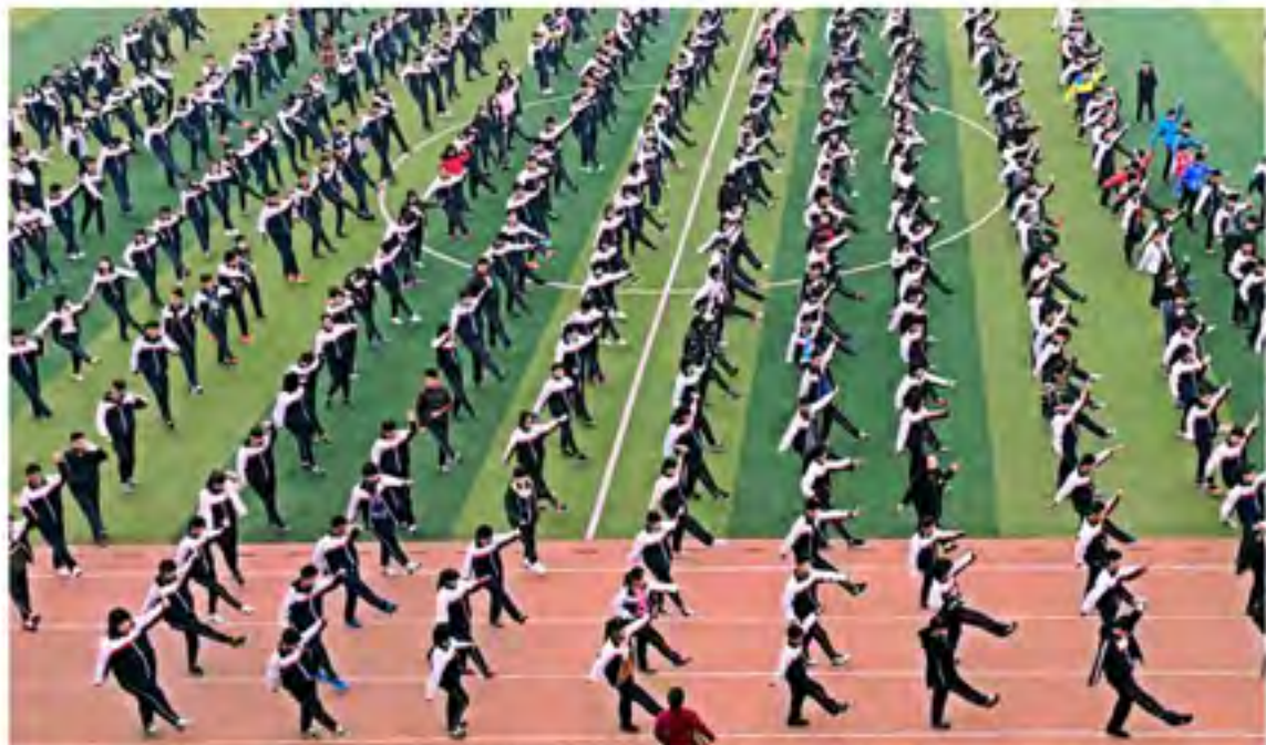
沧州市将“武术进校园”纳入教学计划，这是沧州市民族中学把武术动作汇编进课内操，将传统武术融入到学生们的日常生活