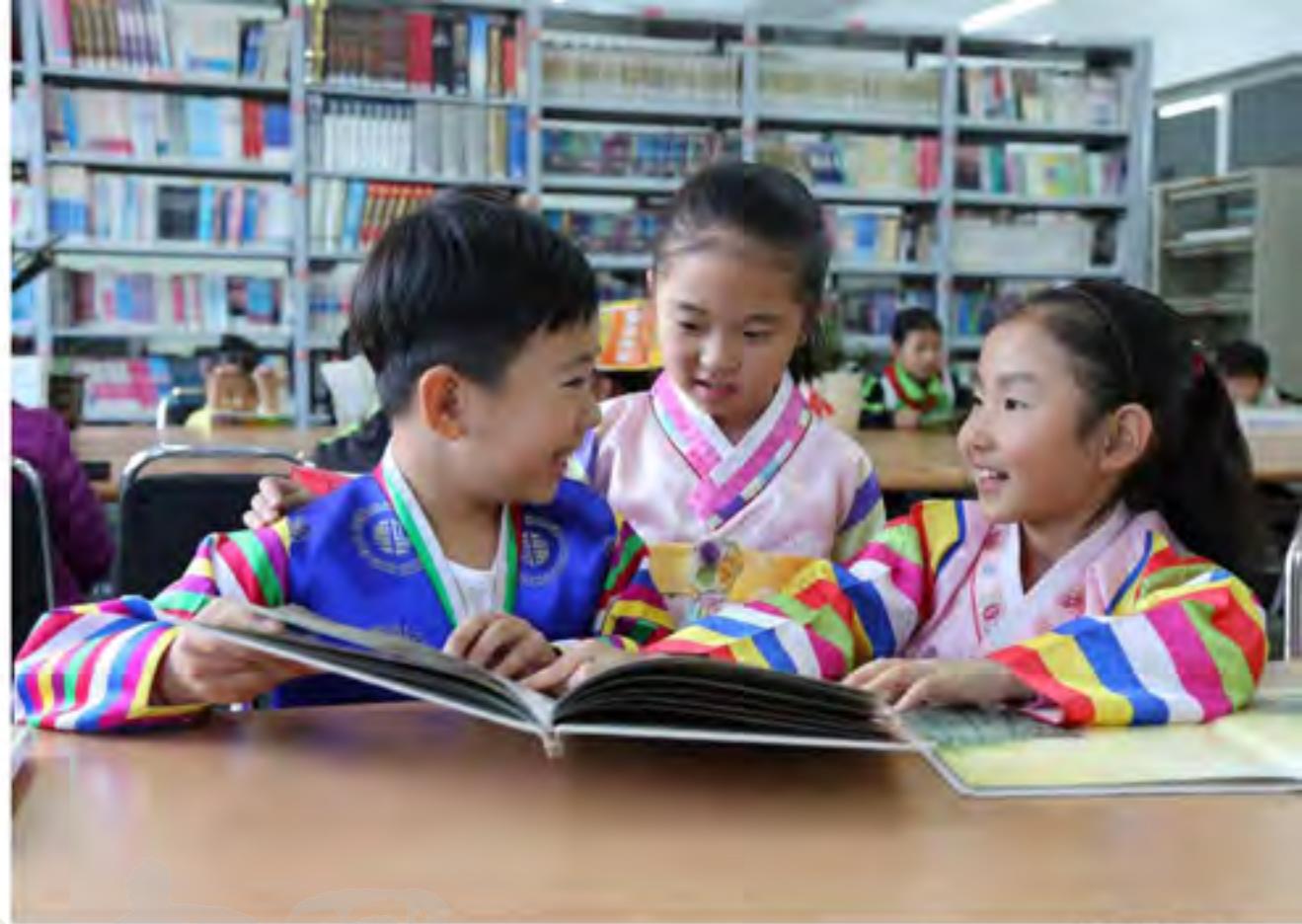
学生在图书室阅读