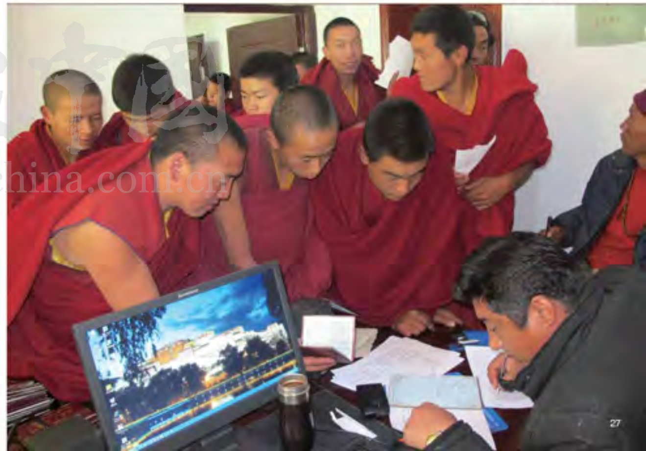
在编僧尼登记参加社会保险

五年来，全区各级各部门认真贯彻落实自治区党委的决策部署，加强和创新寺庙管理工作，在实践中探索，在探索中创新，在创新中深化，取得了丰硕成果。首先是成立自治区宗教工作领导小组，领导小组在自治区党委的直接领导下，负责统筹协调组织各方力量，研究宗教领域重大问题，出台政策举措，指导有关部门开展工作，构建了党委领导、政府负责、统战部门统筹协调、宗教事务部门依法管理、有关部门全力配合的宗教工作体制，有力地推动了宗教事务社会化进程。其次是推动建立寺庙管理长效机制，坚持把寺庙管