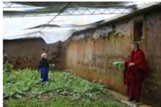
偏远山区的僧尼们在大棚种植蔬菜，自给自足