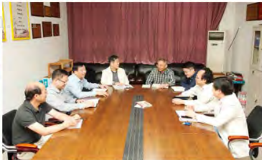
团队成员听取各自研究进展，并商讨下一阶段工作重点