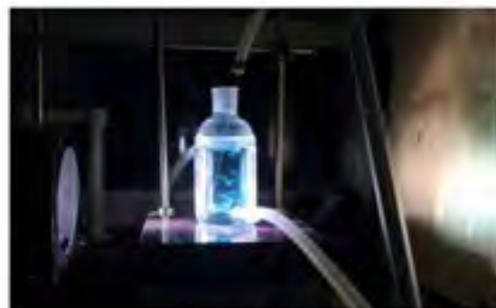
演示水污染降解过程的荧光实验装置

在常温常压下有有机污染物的分解和矿化。“这种新型化合物在全球范围内研究的人都比较少，国外的专家学者也在相关文献综述中充分肯定了我们这方面的探索工作。”邓克位教授称。