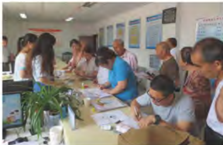
社区为居民代办公文

“大姐，您看您年纪大了，别跟年轻人计较，他们白天上班，您就出门遛遛弯，权当锻炼身体了！我也劝劝他们，让您对门那家尽快来修完。您看行吗？”