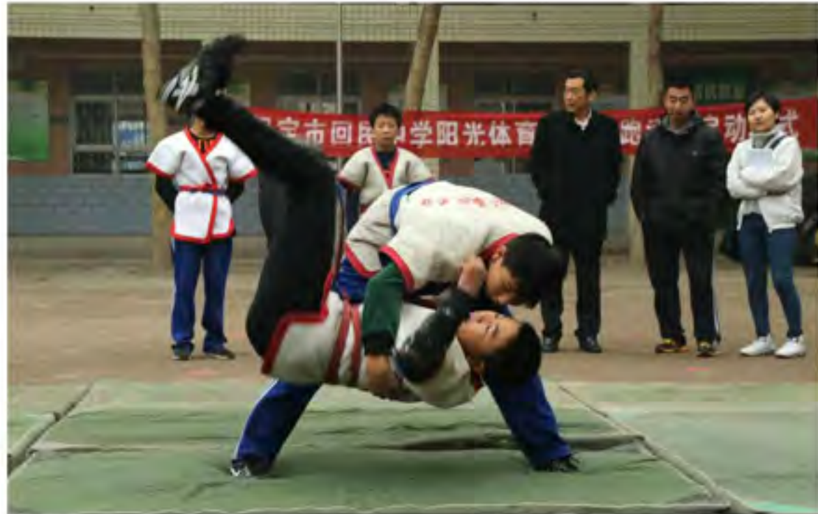
学生们热心地向我们展示保定快跤的技巧，上盘把位占先，下盘侧腿，上下配合，以快打快