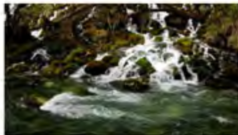
大龙沟人文生态景区

滴水岩又名“扎卡曲”，位于建设乡扎盘村境内，北距县城约5公里。它是嘎拖寺、白玉寺高僧的修行处，每处石洞都有美妙的传说故事。它与边乌草坝上的“猴子湖”“月亮湖”构成完美的旅游景点。传说此处原来是格萨尔王妃珠姆的行宫，珠姆王妃在此梳头时，将头发扔到山上，头发变成了茂密的树林。该处有一个叫“扎