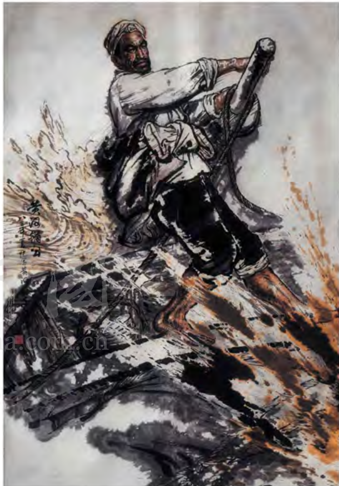
《黄河颂》 1983年 (135cmx200cm)