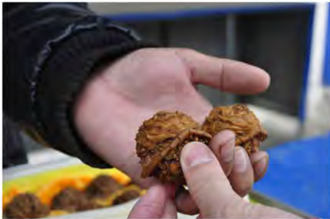
去东方朔冬令展陈列过的小核桃

子负责从白沟进料，他和妻子在乡里各办一个厂子，生产的薯包主要出口到俄罗斯，最多的时候一个季度有三万多订单。