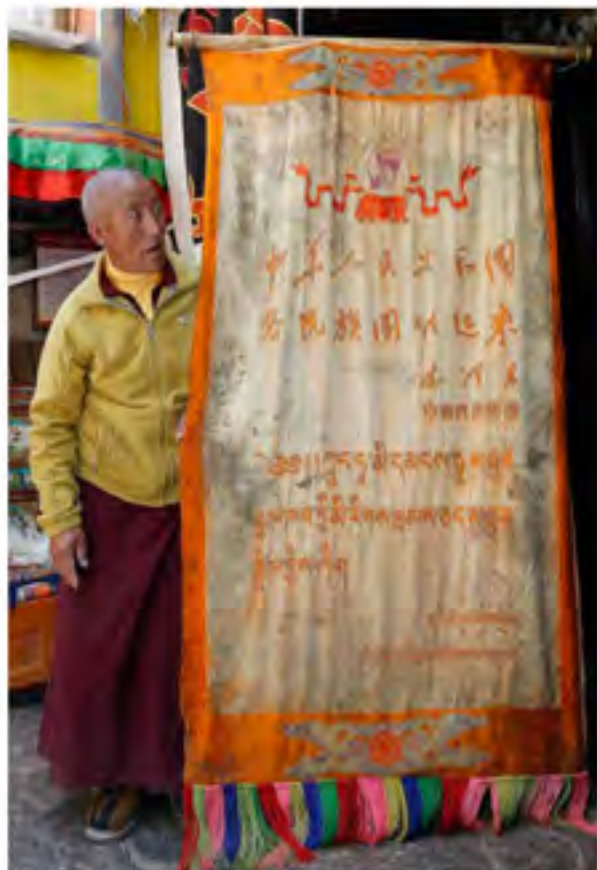
阿里地区科地寺完好地保存了1954年中央代表团赠送的礼品