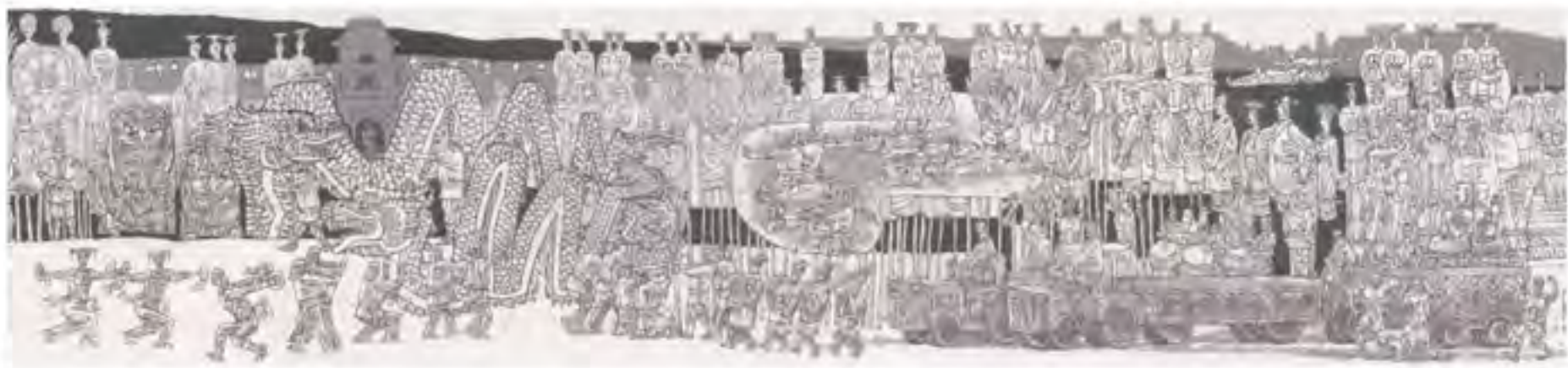
《礼天》2015年 (30m x 3m) (局部)