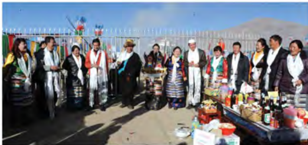
各族群众一起共度藏历新年