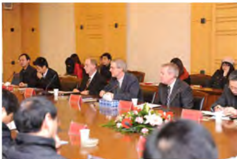
开展国际合作。图为美国威斯康星大学专家来校参与饮用水与废水处理研讨会