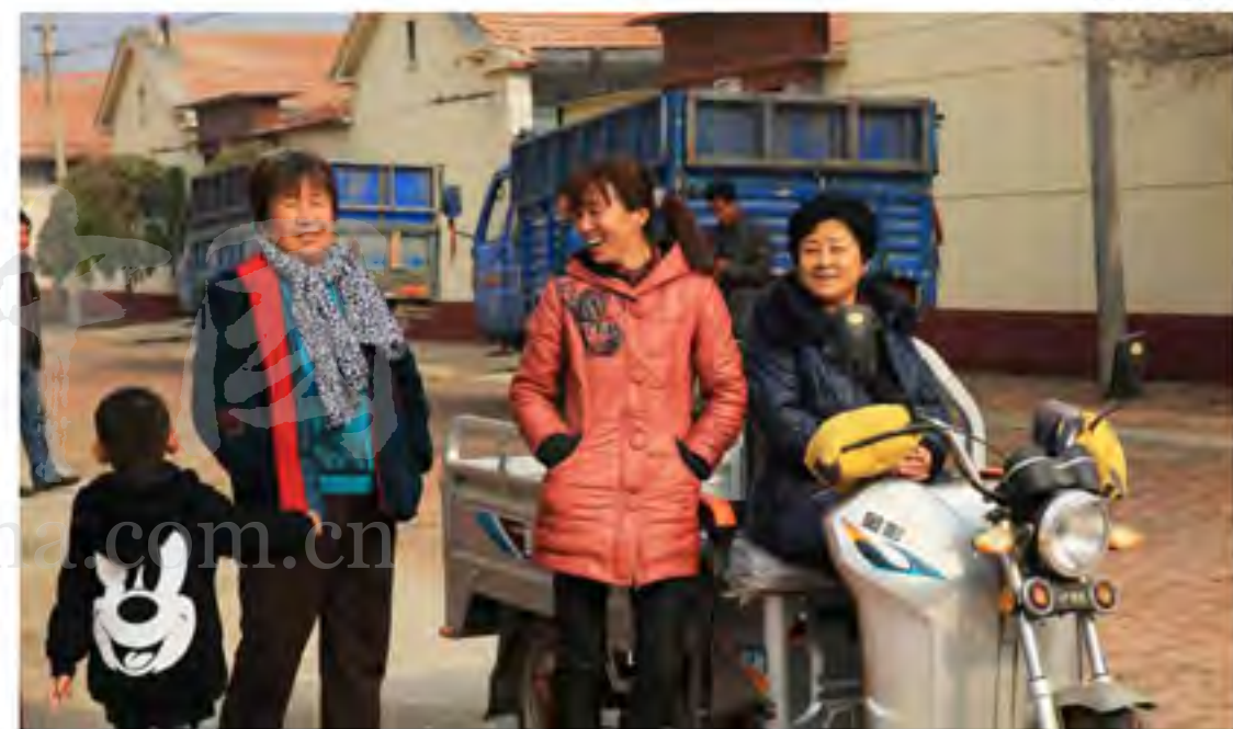
邻里之间其乐融融

如今刘皮庄村发生的变化，不只是村容村貌，更是由“里子”向“面子”的变化，美丽的村貌是一方面，富足安康的生活才是百姓们最值得炫耀的。刘皮庄村紧靠邻城，交通便利，北倚城北工业园区的区位优势，大力发展汽车维修与汽车配件业、餐饮服务业、商贸物流业等优势特色产业，其中省级农业产业化龙头企业顺伊城清真肉类有限公司是全市最大的集养殖、屠宰、加工、销售为一体的肉食品公司，也是黄骅市唯一一家清真定点屠宰单位，解决就业500余人，与周边村庄数十户农户、农场、合作社合作进行畜牧养殖