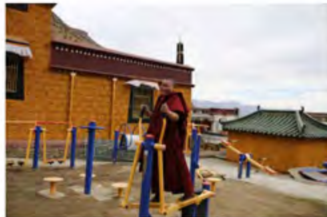
格日寺安置的健身设备