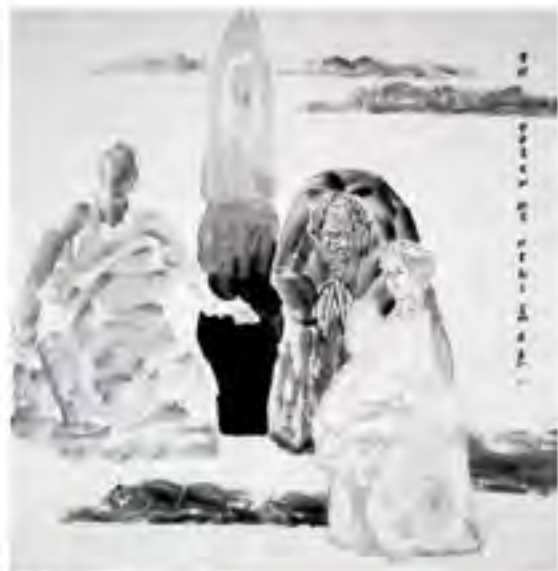
《雪域》2014年 (204cm x 130cm)