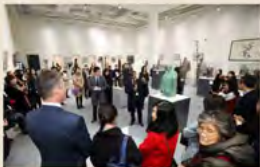
▲2016年12月11日，在丝绸之路城市联盟和中国雕塑院邀请，来自德国、荷兰、西班牙、乌克兰、希腊、马耳他、埃及、韩国、泰国、蒙古等国的驻华大使和文化参赞走进中国雕塑院，参观著名雕塑家、中国美术馆馆长刘开渠先生的雕塑作品，探究这位艺术家创作的艰辛过程，听他讲述雕塑创作中的文化观，从而触摸和把握一件件作品中蕴含的人文情怀和艺术之魂。