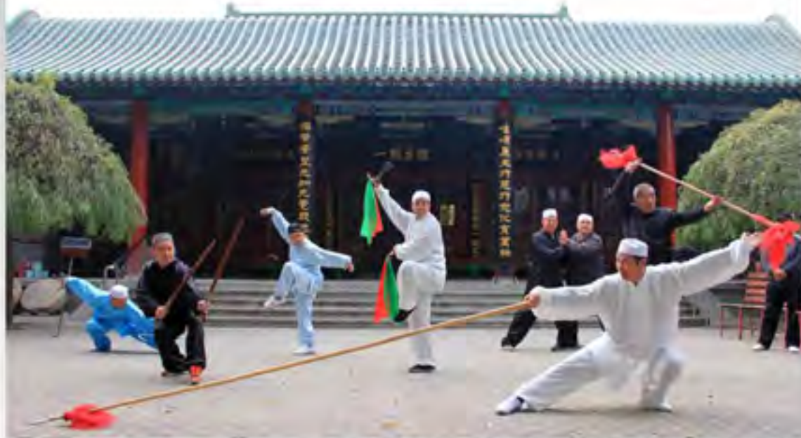
沧州回族世代习武，当地回族武术爱好者常在清真北大寺绿树成荫的院落里切磋技艺

河北沧州，午后的清真北大寺在闹市区里愈发显得宁静安详。这座已有六百多年历史的清真寺，采用中国传统建筑形式，古色古香。