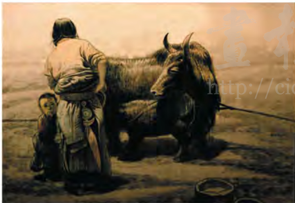
《大河之源》之四 1988年 (80cmx130cm)

现任中国国家画院院长，全国政协委员，中国美术家协会副主席，中国文联全委，国家三五八人才计划，四一一批人才，国家突出贡献专家，教育部高教名师。