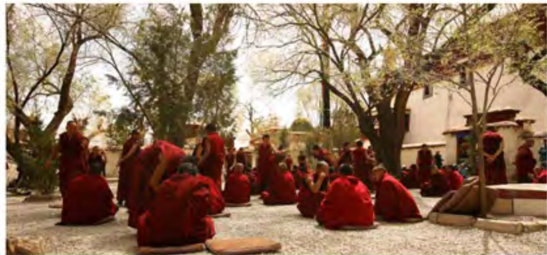
辩经是僧人的必修功课