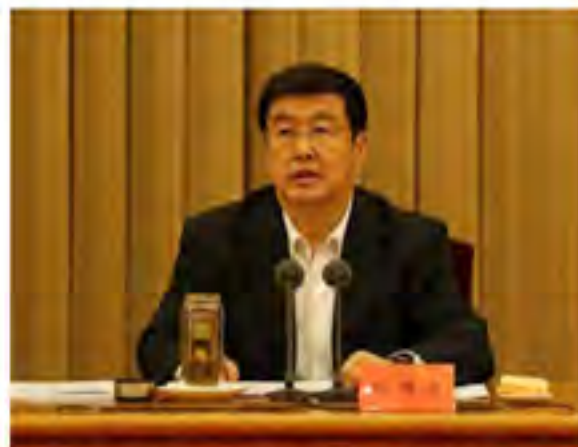
中共中央统战部副部长，国家民委主任、党组书记巴特尔主持国家民委委员全体会议，并在全国民委主任会议上讲话