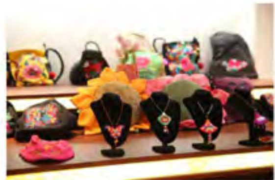
寨家公社设计的绣坊时尚产品