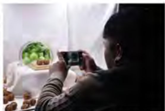
店铺老板在迷你摄影棚中拍照，随即将麻核桃的照片发布在淘宝上