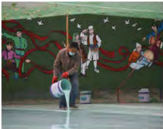
为保证学生体育活动的多样性，学校正在修建崭新的篮球馆