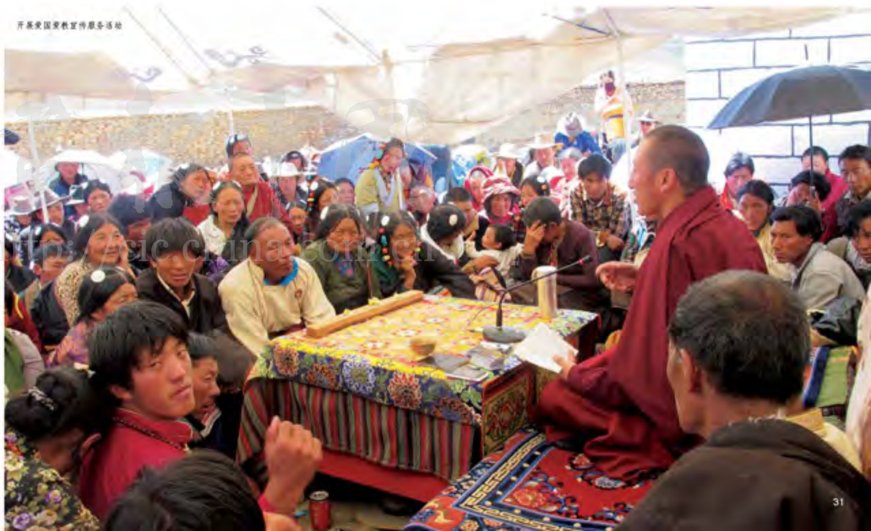
开展爱国主义教育服务活动