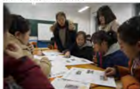
校刊社的同学们在点评新出版的校刊