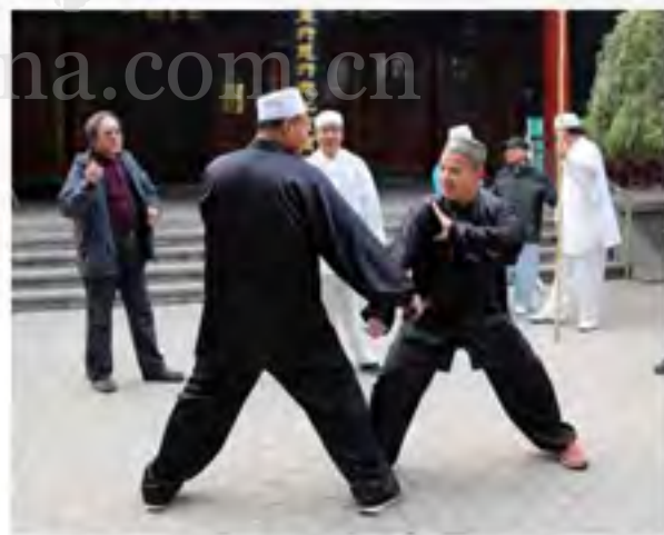
青年在沧州清真北大寺内互相切磋武术交流经验的当地回族武术爱好者

走出清真北大寺，一街之隔就是沧州市回民族文化协会所在地。回民族文化协会于2008年成立至今一直致力于挖掘沧州回族传统文化