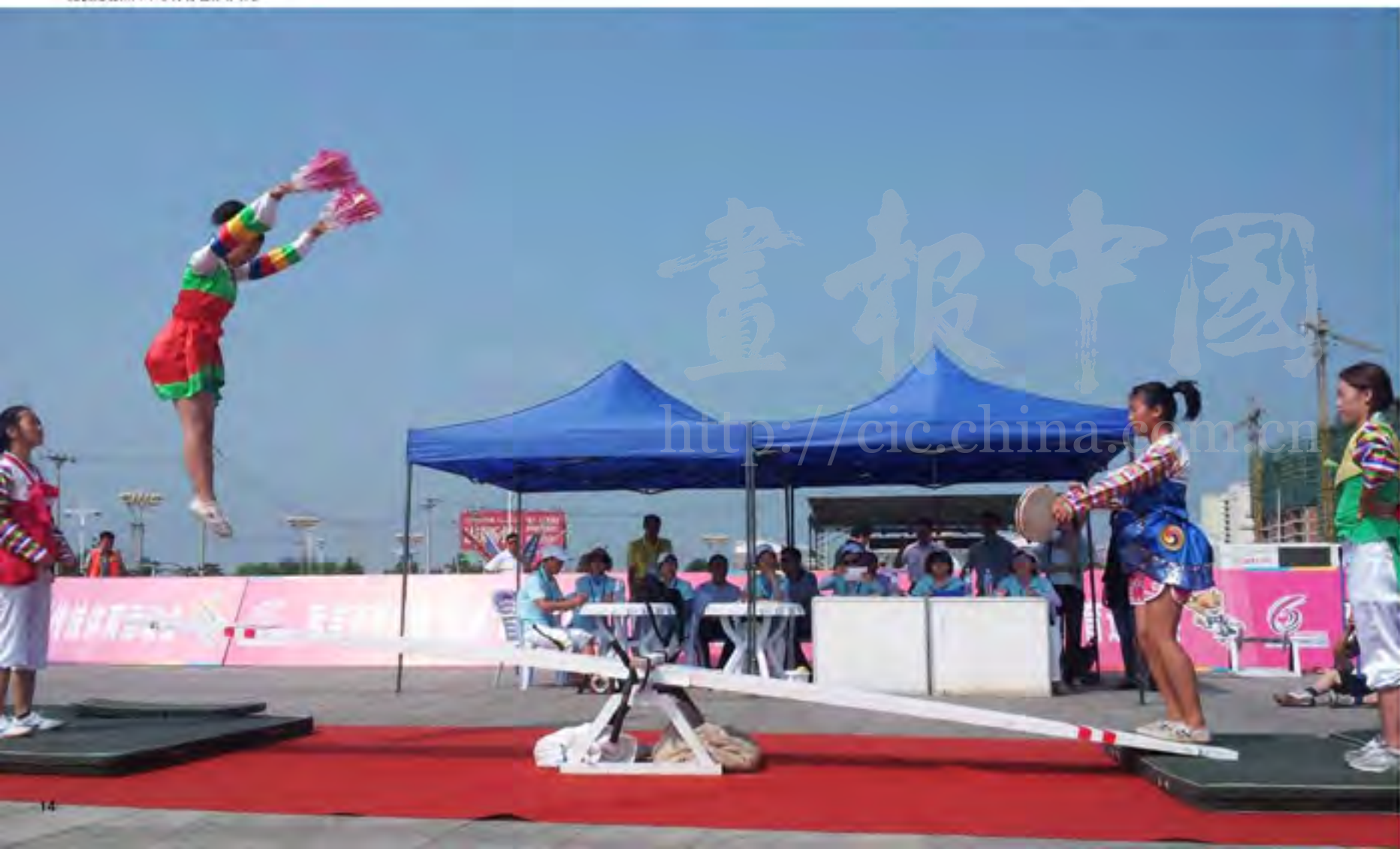
跳板是朝阳川小学的特色体育项目