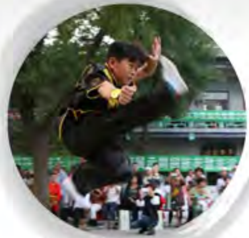
沧州回族武术文化得到传承和弘扬，这是在清真北大寺举行的回民族文化展示周上的武术表演