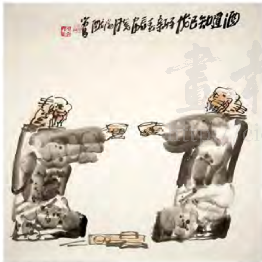
《酒逢知己》2009年 (69cm x 95cm)

有甚者利用网和方法，写画自然，真正的是“形神兼备”，然而以自然之形的临摹所体现对象之神为初学者，仅自物感感受而已。以形写神，中西无异，而以敏感于对象之元神，直追摄魂之神，造就取神，得鱼忘筌，以神写形则更高一筹，非一般能及也。