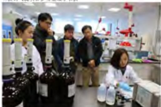
农产品质量与安全评价实验室的研究人员正在向韩国商家介绍自主研发的气流吹扫多功能萃取仪

医学院的采访让我们大开了眼界。专门的陈列室里，甚至走廊两边都是人体各个部位的标本。形态学研究中