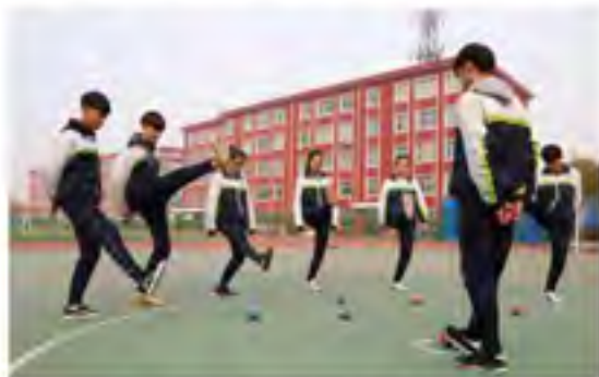
除传统武术外，沧州市民族中学积极开展少数民族体育项目，足球、篮球、板鞋竞速是学校的优势项目