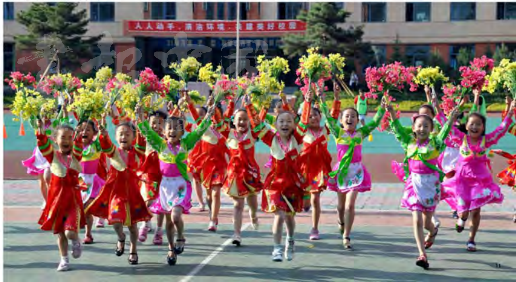
自信、乐观、好学的延边朝鲜族儿童