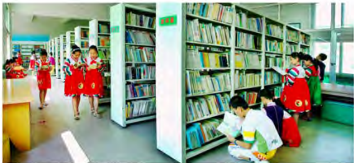
在延边，从小学到大学，学校里都会有一所图书馆（本刊资料）

单行政干部训练班、函授师范和农业、卫生、艺术等专业学校，在延边州初步形成了民族教育体系。各级各类民族学校都使用本民族语言文字编写教材，教学用语为本民族语言。