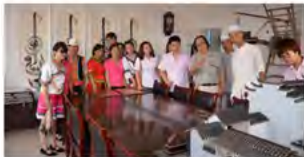
社区居民代表参观民族文物