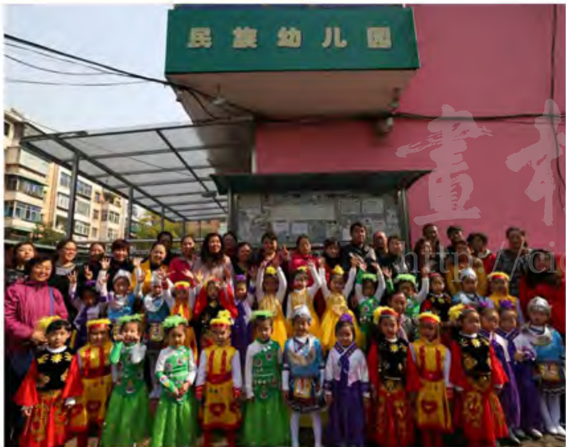
太原市尖草坪民族艺术幼儿园的部分师生和家长