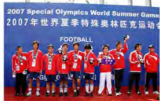
2007年10月，代表国家参赛的珲春市特殊学校足球队在第十二届世界特殊奥运会上夺得银牌（本刊资料）