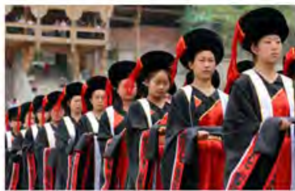
重九九道门城楼祭祀