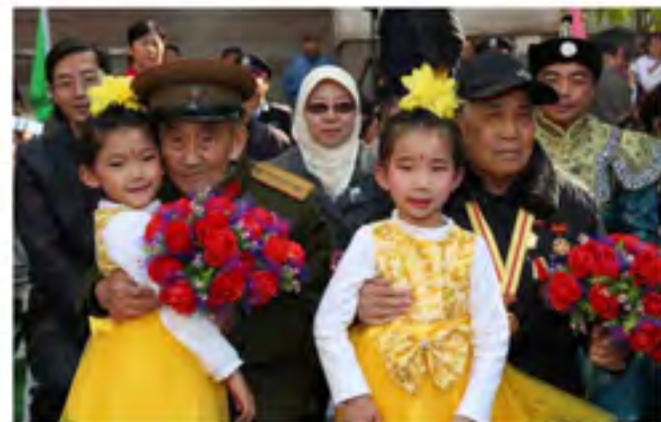
纪念长征胜利80周年文艺演出上孩子们向老红军献花