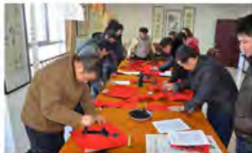
社区书法爱好者在社区书画室挥毫泼墨