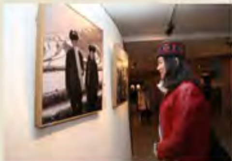
▲2016年12月3日，由国家民委文化宣传司主办，中国民族博物馆承办的“丝路——丝路情，54民族世纪爱国颂”展在北京中华世纪坛开幕，展览以丝路沿线的54个民族完成的各种民族人物肖像摄影作品为主要内容，展示了不同民族的服饰风貌及其所蕴含的古老的地理价值与深厚的情感价值。