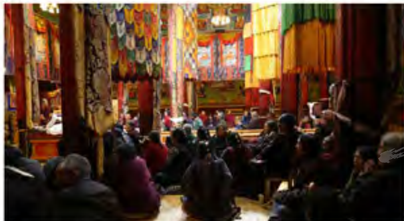
昌都地区江达县觉寺大经堂