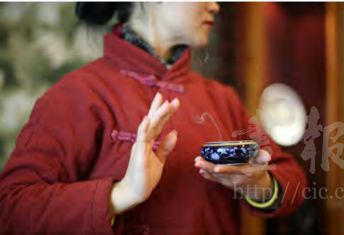
香艺师展示“古法篆香”