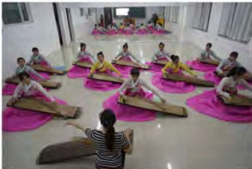
学生们在老师的指导下练习朝鲜族传统乐器伽倻琴

的做法表面上看似乎是对升学率的不重视，实际上却激发了学生的学习热情，提高了学习效率，升学率反而有所提升。以2016年为例，延边一中的一本上线率是61%，二本上线率是97%，全校有280余人考入了全国各地的名牌大学，其中有16人考上了北大、清华和复旦大学。