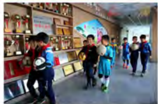
延边州的足球全国闻名，在这里足球有很好的传统教育土壤