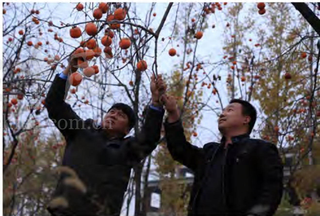
柿子挂满枝头的季节，西曹营满族村的村干部正指导怎样将柿子变成商品