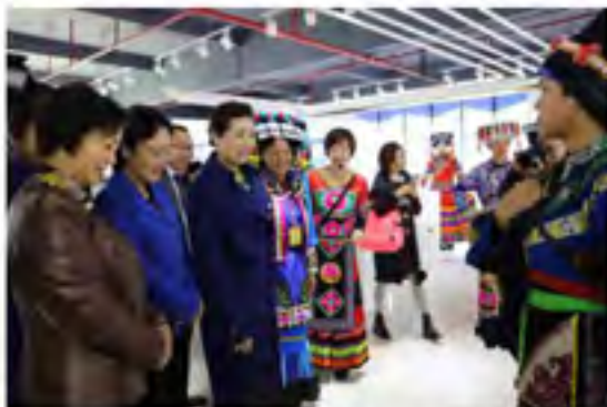
云南省妇联主席和红梅（右二），楚雄州委副书记赵海仙（左一）到楚雄调研绣产业发展情况

现在寨家公社的主要产品种类繁多，服装系列，主要是保护和传承彝族原始的服装，各种服饰的创作大都以花、虫、鸟、兽等图案绣制，饰品系列，大多都是属于公司研发的新产品，一般都是以