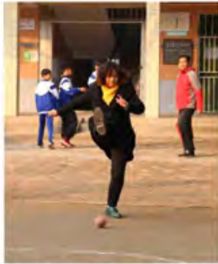
蹴球也是回民中学的特色运动，老师向我们展示蹴球的基本动作