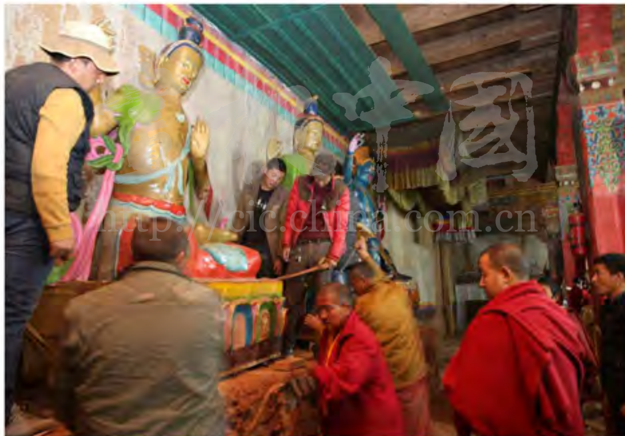
昌都地区芒康县绿色寺修缮佛像

理纳入社会公共服务管理范畴，把寺庙作为基本的社会组织，把僧尼工作作为重要的群众工作，按照分类指导、区别对待的原则，组建寺庙管理委员会（片区寺庙管委会），寺管会认真履行教育、管理、服务职能，指导寺庙开展人、财、物和佛事活动规范管理，实施寺庙僧尼基本公共服务项目，教育引导僧尼爱国爱教、遵规守法，自觉维护民族团结和宗教领域和谐，极大地扭转了过去寺庙基本公共服务无人管、部分寺庙僧尼放任自流的面貌。再次是依法加强寺庙僧尼的管理，结合藏传佛教寺庙实际，依法开展宗教教职人员备案、宗教活动场所主要教职任职备案，以及宗教活动场所证、法人证、宗教教职人员证（活佛证）登记发放等基础性工作，指导寺庙依照国家相关法律法规，进一步规范寺庙财务制度和财务工作，规范寺庙僧尼管理，同时全面落实“利学惠僧”政策，大力实施“九有”工程，使全区寺庙有领袖像，有国旗、有路、有水、有电、有广播电影电视、有通讯、有报纸、有文化书屋，部分地区积极拓展“九+”模式，新建或维修寺庙食堂、浴室、温室、垃圾池等，极大地改善了僧尼的修行和生活环境。深入开展“六个一”活动，把僧尼纳入社会保障体系，实现僧尼医疗保险、养老保险、人身意外伤害险和最低生活保障全覆盖，每年免费体检并建档。在45座100人以上寺庙统一修建养老院，使僧尼“老有所养”。支持高僧大德对藏传佛教的教义教规进行符合时代进步要求的阐释，组织高僧大德开展爱国爱教宣传服务下乡活动，到农牧区、到寺庙进行宣讲，充分发挥宗教界在党和政府与信教群众之间的桥梁作用。建立藏传佛教现代教学和学术制度，高标准建设西藏佛学院，依托和清模范寺庙，建设佛学院分院，培养了一大批年轻僧才。同时，不忘在宗教领域开展民族团结工作，坚持以和为贵、和合共生、爱国守法、增进僧尼创建评选活动为契机，在广大僧尼中广泛开展爱国主义和民