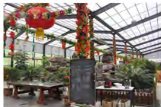
安阳村调族乡安阳村的生态餐厅，以纯天然食材为特色，很多游客慕名而来