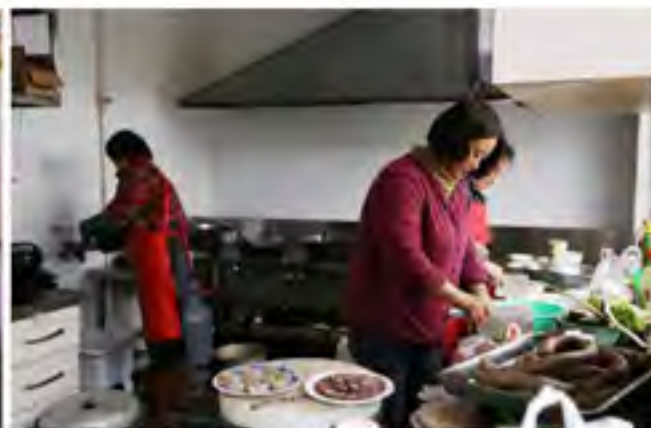
“满家乐”民俗展馆的厨房里,村里的几个妇女正在给游客做地方菜人准备大餐

凤凰台村的花卉苗木种植业则是利用土地流转形式,把土地集中起来,实行大户承包,全村花卉苗木种植面积达亩以上,成为村民增收的又一重要渠道。