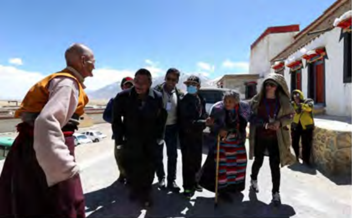
阿里地区噶尔县扎西岗寺的僧人与信众亲如一家