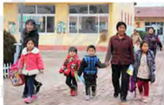
王古宅村的村民排自己孩子回家