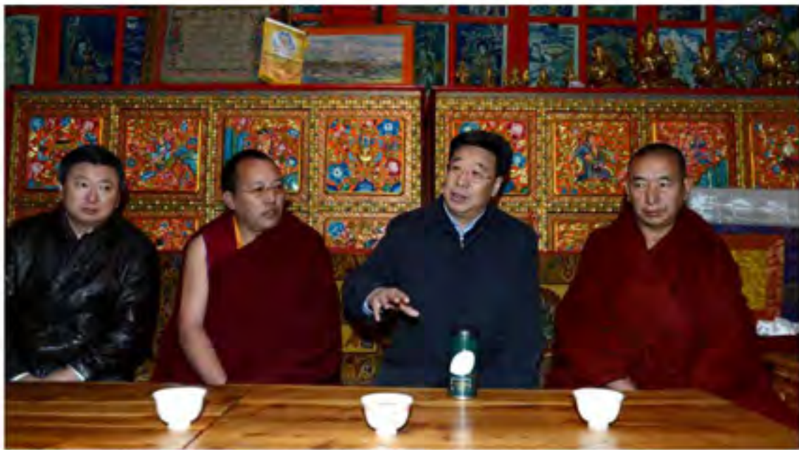
2014年2月14日，自治区各副书记吴英杰（右二）来到拉萨市城关区格杰寺调研，并希望慰问僧人和驻寺干部