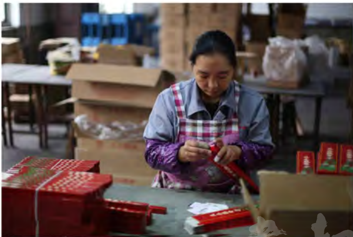
工人为“天木沉香”添加最后一道工序