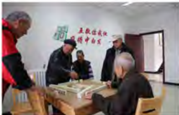
革命战争，社区里的老年人都喜欢到棋牌室去打牌