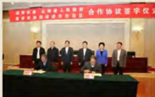
▲2016年12月14日，国家民委与云南省人民政府在北京签署协议，共同推进云南建设民族团结进步示范区。国家民委主任、党组书记巴特尔，副主任、副书记刘慧，副主任陈庆华，专职委员、办公厅主任陈军祥，云南省委书记陈豪，副书记、代省长阮成发，副省长陈强出席签约仪式。早在2011年，为贯彻落实《国务院关于支持云南省加快建设面向西南开放重要桥头堡的意见》精神，国家民委与云南省人民政府签署了合作协议，共同推进云南建设民族团结进步、边疆繁荣稳定示范区。5年来，云南省经济社会呈现良好发展的势头，民族团结进步示范区建设取得了可喜成效。此次续签合作协议，将推动云南民族团结进步示范区建设再上新台阶，有力推动民族地区团结进步事业创新发展。