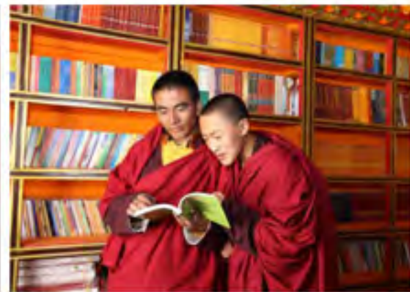
阿里地区噶尔县门士乡定达布日寺的文化书屋