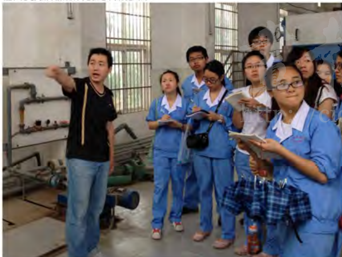
校企实习基地。图为中南民族大学学生在三金潭污水处理厂实习