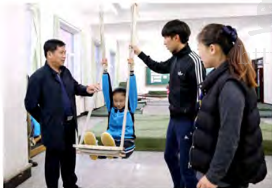
运动器材的安全问题是校长和老师最关心的问题之一