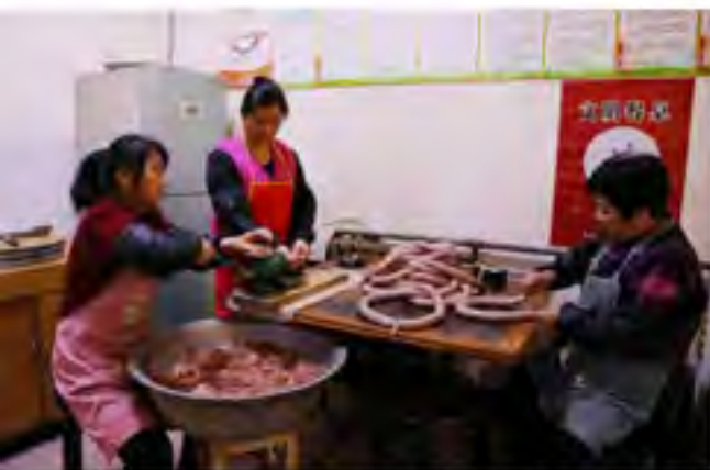
苏老字子苏老伴(右)和儿媳(中)在制作香酥,苏老字子把厨艺传给了儿媳