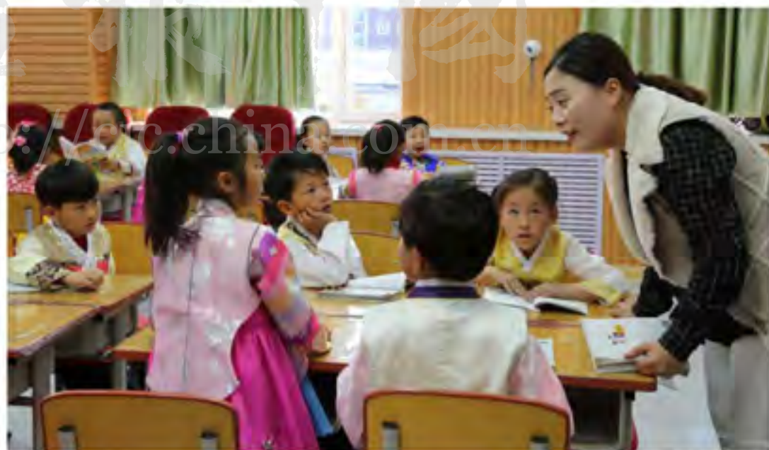
学生认真思考并大胆回答老师提出的问题