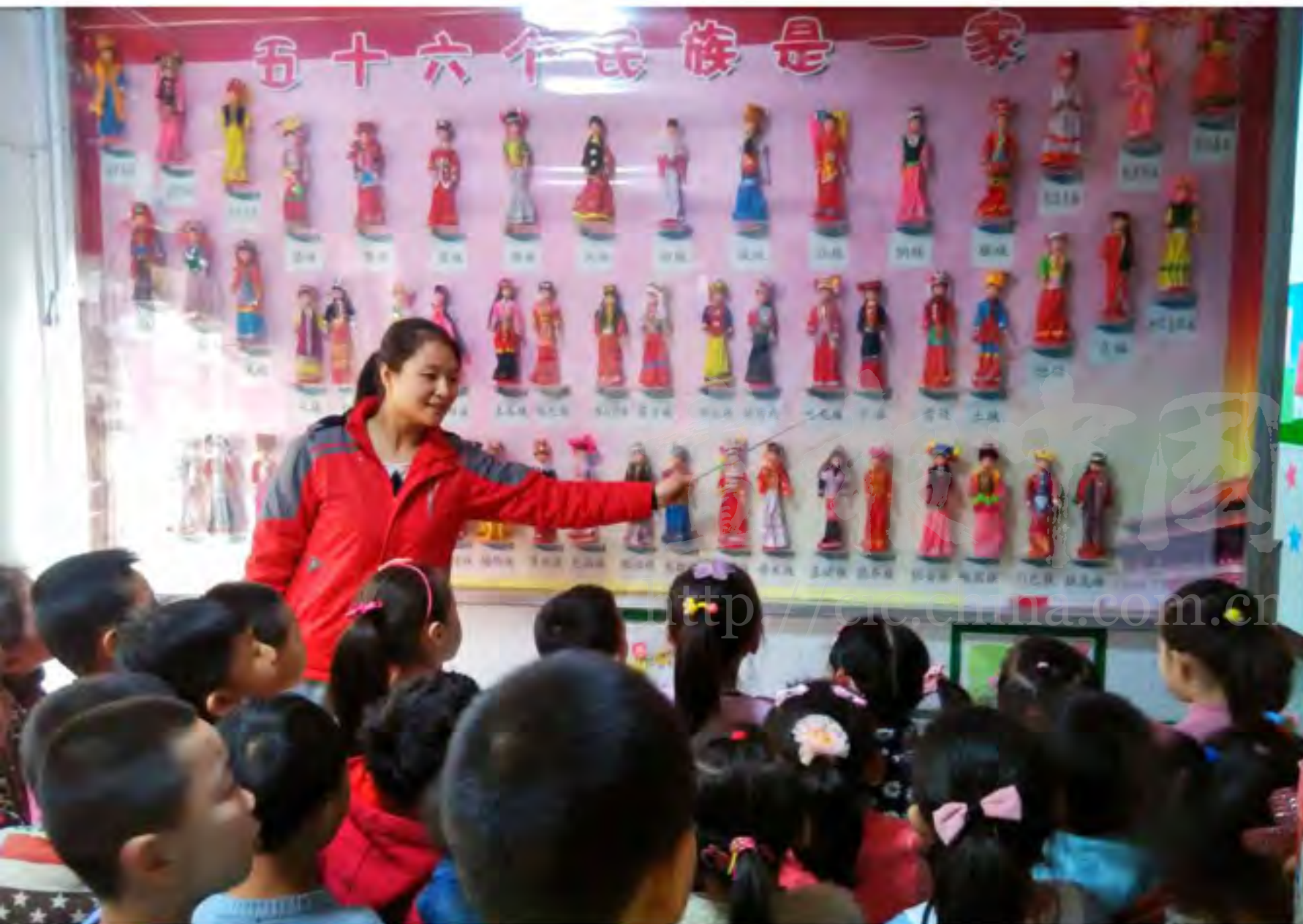
孩子们会民族文化墙前了解民族服饰