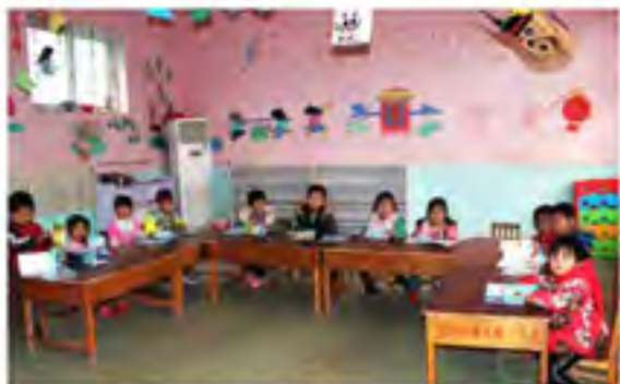
附近的回汉小朋友都在这所韩集镇王古宅村幼儿园上学

之间的和气以及他们对现在生活的满意。在王古宅村采访时，正遇村幼儿园的孩子放学了，孩子们你追我赶，整条街都回响着他们的笑声。