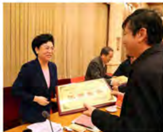
全国民委主任会议表彰了国家民委2016年度全国民委系统信息工作先进集体和优秀个人。这是国家民委副主任、党组副书记刘慧力颁奖单位颁奖