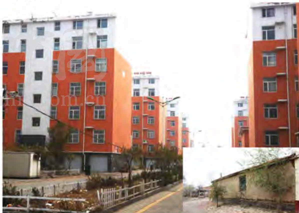
刘皮庄村以前的老房子