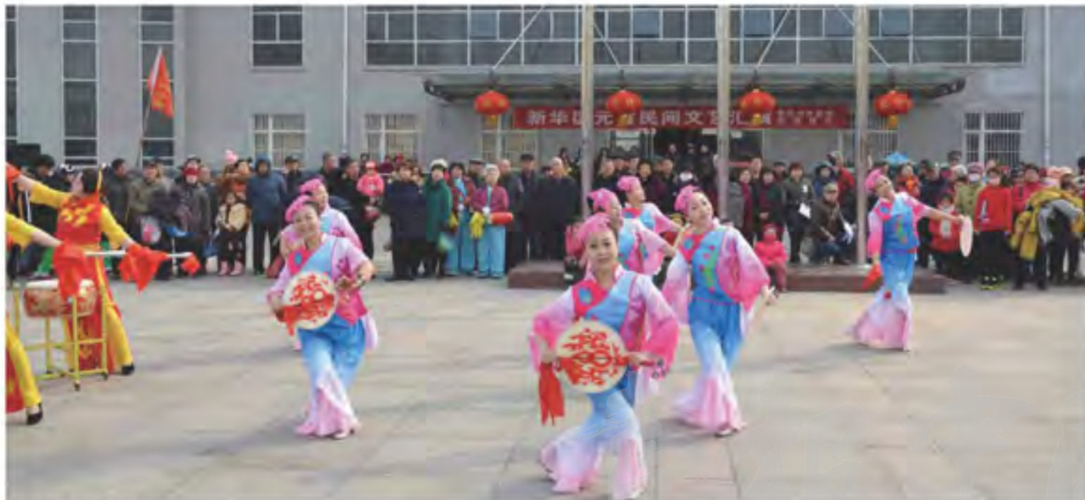
社区举办的春节民俗文化活动