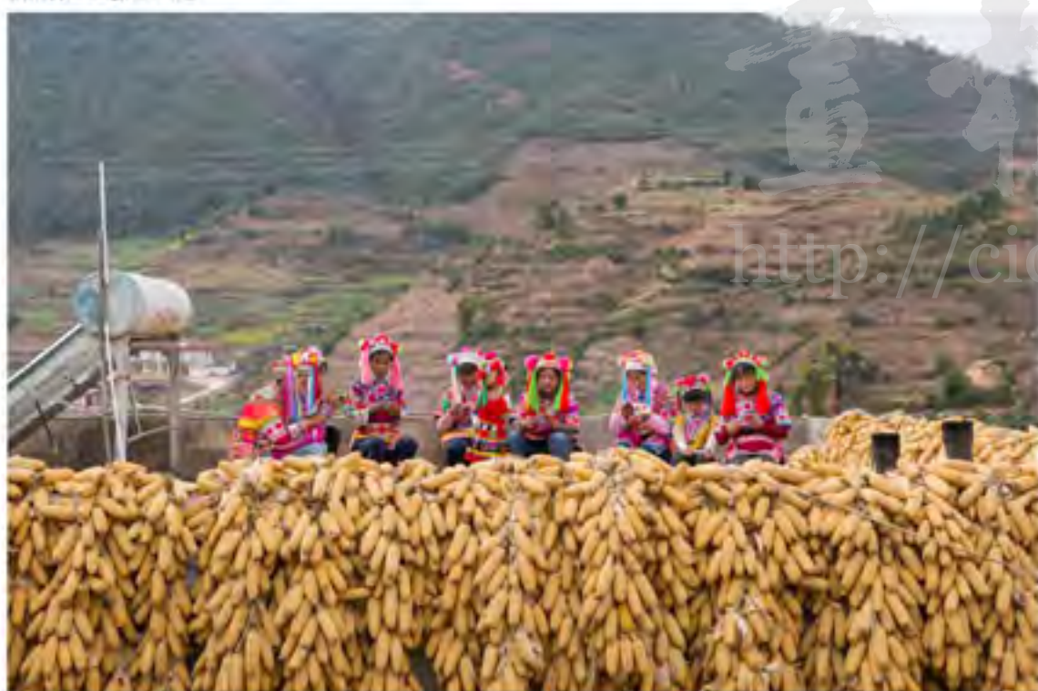
绣娘们在田间地头展示技艺