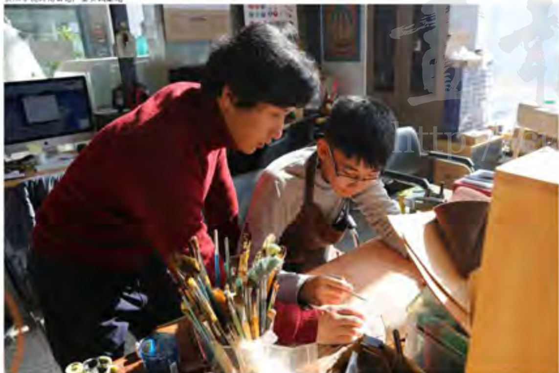
美术学院文化创意产业实践基地