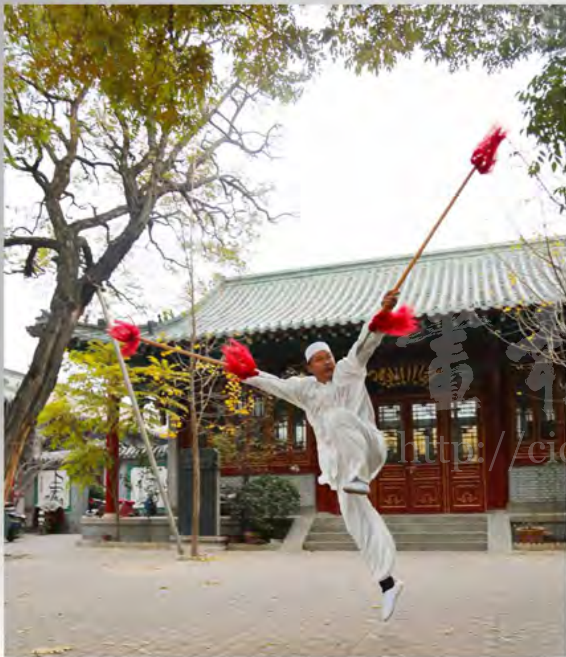
沧州回族武术门派很多，这是英姿飒爽的六合双枪