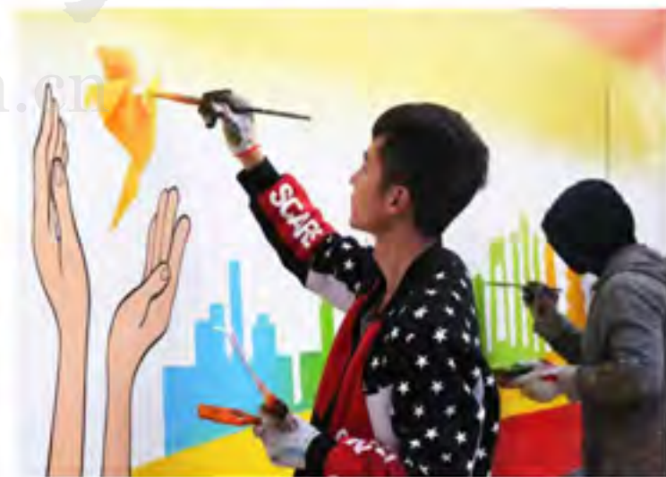
善民正为村里绘画装饰