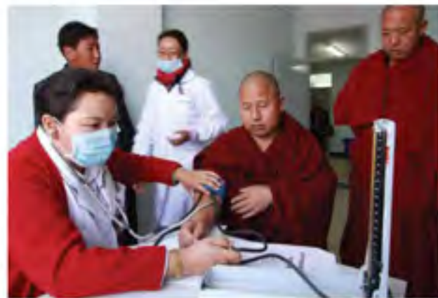
为僧人进行免费体检