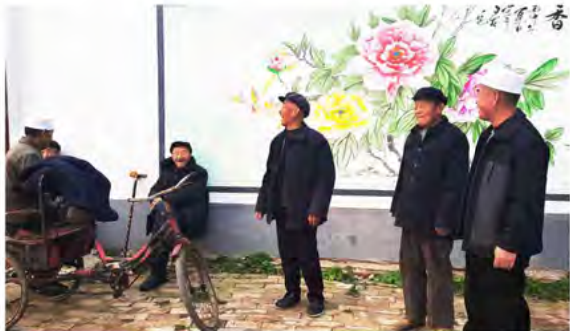
谈笑风生的回汉老人

改革开放以来，王古宅的村容村貌发生了巨大变化，村里新建的别墅俨然林立，灵动的广场舞而不俗，幼儿园欢声笑语，衣车工业双管齐下，安全饮水，村庄通信网络也都已走进千家万户中。关键是村民的腰包鼓起来了，脸上的笑容多起来了。街边三五成群的回汉老人坐在一起唠家常，他们之中有的是普通村民，有的是退休的村干部，从他们的言语之间我们可以感受到回汉两个民族