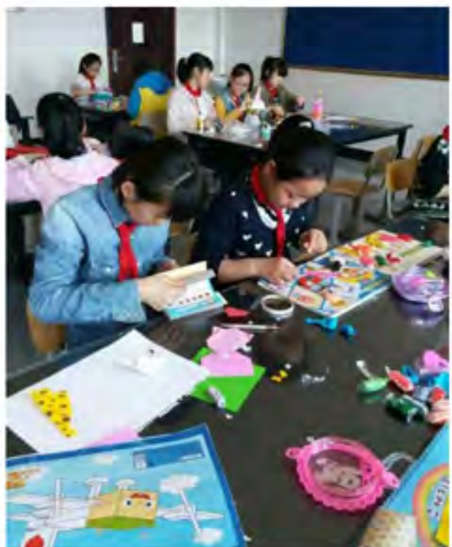
上手工课的小班课堂