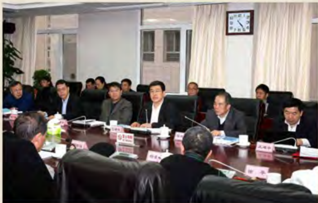
▲2016年12月21日，第二届国家民族决策咨询委员会第一次全体会议在北京召开，国家民委主任、党组书记，决策咨询委员会主任巴特尔出席并作工作报告，巴特尔指出，党的十八大以来，以习近平同志为核心的党中央高度重视智库建设，国家民委按照中央精神成立决策咨询委员会，就是要推动科学决策、民主决策、依法决策，集思广益，群策群力，为国家民族事务决策提供智慧力量。会上，与会委员围绕民族地区全面建成小康社会建设、精准扶贫脱贫、少数民族流动人口管理等问题，踊跃发言，建言献策。据悉，本届委员会由27人组成，其中少数民族委员23人。