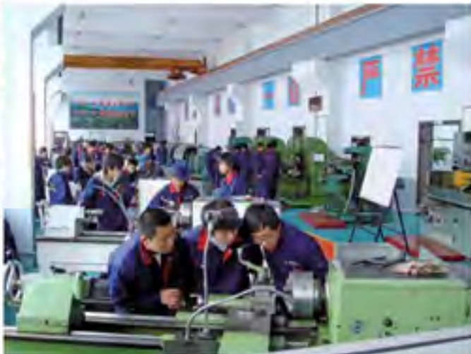
延边州职业教育专业齐全，为社会培养了急需的专业人才，图为龙井市职业高级中学教学课堂