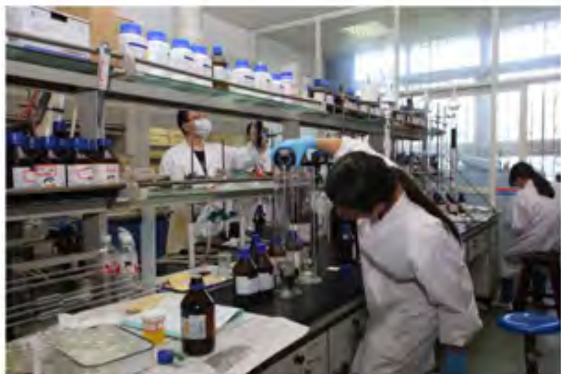
催化材料科学重点实验室