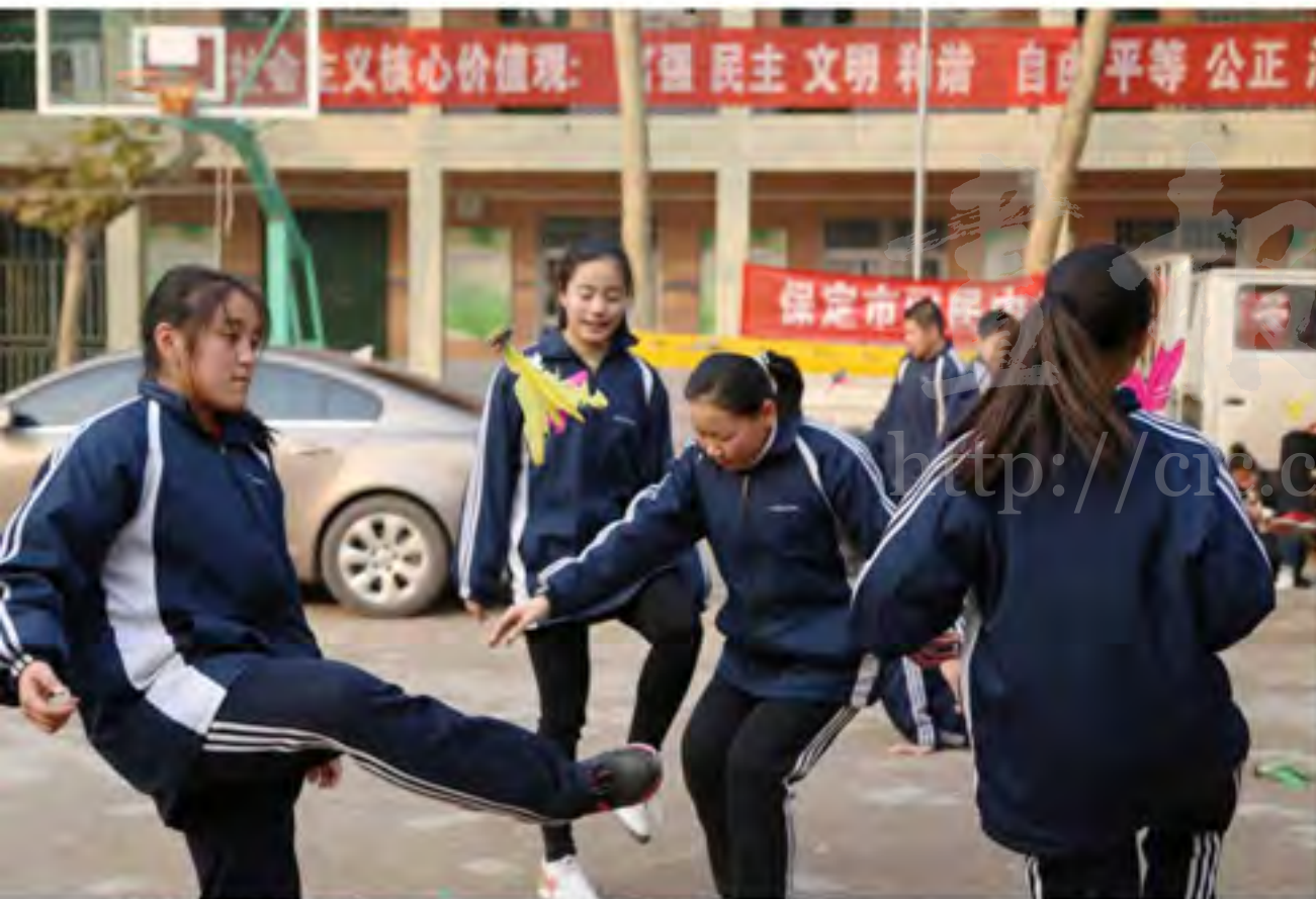
蹴球是学生们最喜欢的课余活动之一