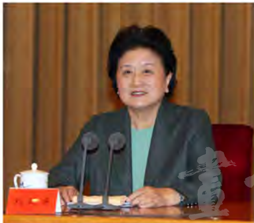
中共中央政治局委员、国务院副总理刘延东出席国家民委委员全体会议并讲话