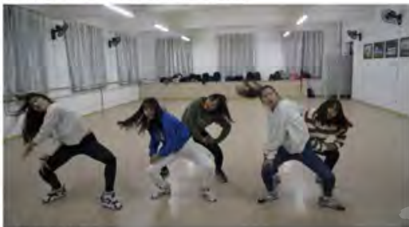
在舞蹈室练习街舞的学生