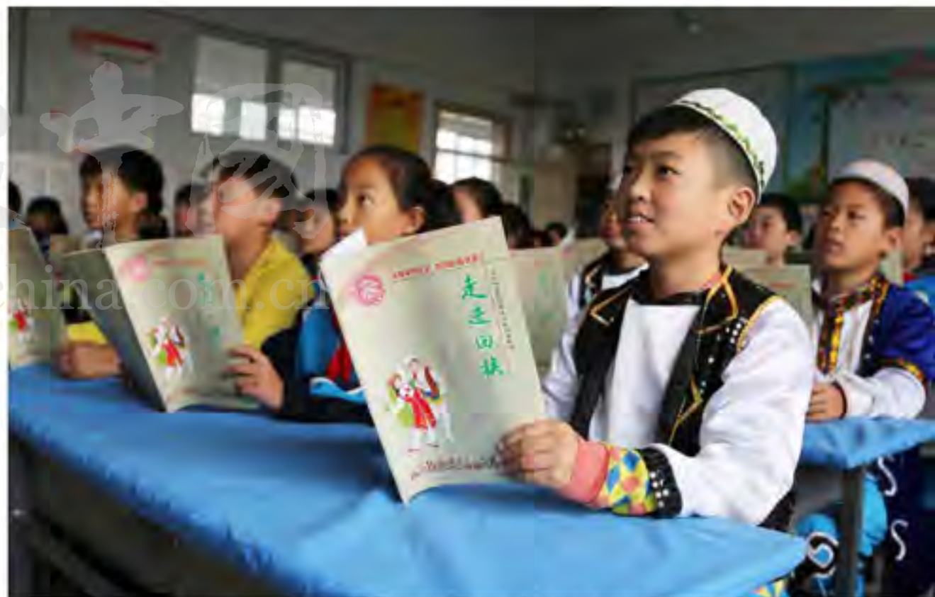
以“弘扬爱国主义 传承民族文化”为主题的校本教材《走进回族》进入沧州市运河区国民小学的课堂