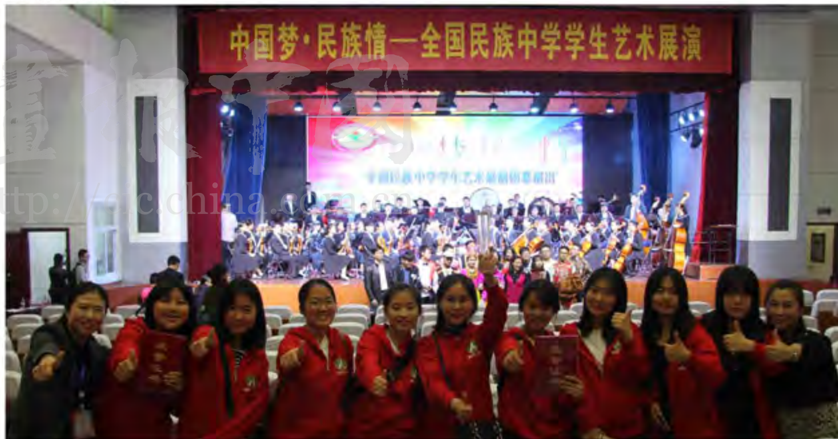
延边一中的学生们在全国民族中学学生艺术展演中取得优异成绩