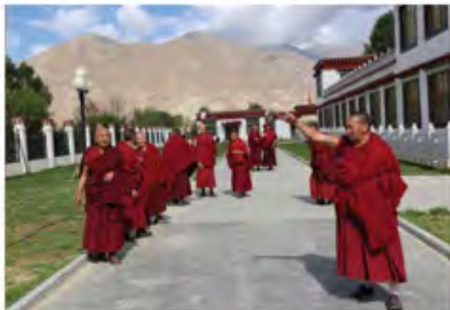
新修建的养老院切实解决了僧尼养老难的问题