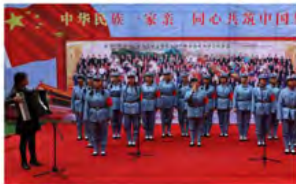
教师们表演的《长征组歌》