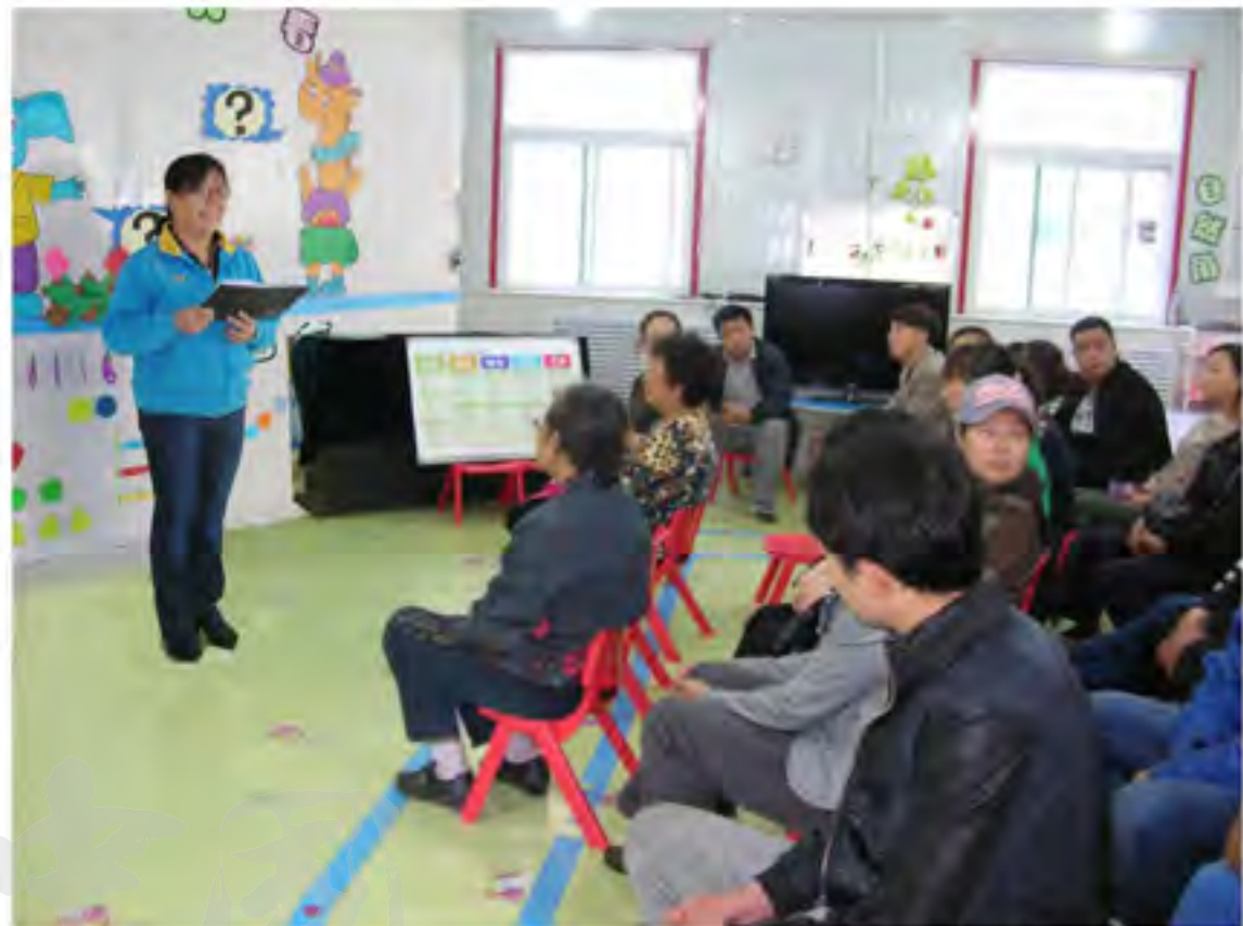
特教开家长会课上强调民族团结的重要性

园每天课间均以各民族歌舞为主。充分发挥文体活动的德育载体功能，在幼儿中广泛开展了“会说一句民族语言、会画一幅民族题材画、会唱一首民族歌曲、会跳一个民族舞蹈、会讲一个民族故事”活动。举行民族团结教育系列活动“民族文化大家讲”“民族精神代代传”“民族之花齐开放”“知我中华、爱我中华”知识问答，以及“歌颂中华大家歌”民族歌舞汇演等。