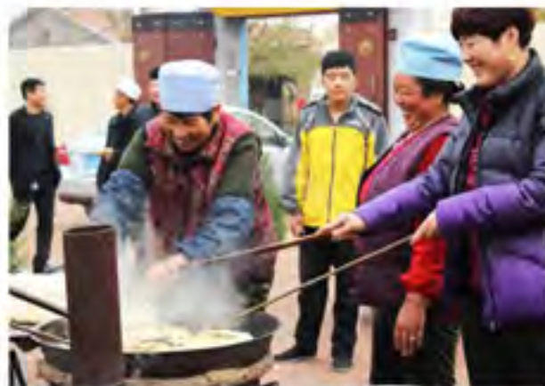
回族村民为圣纪节做准备——炸油香