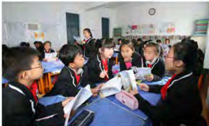
孩子们在轻松的教学氛围里学知识