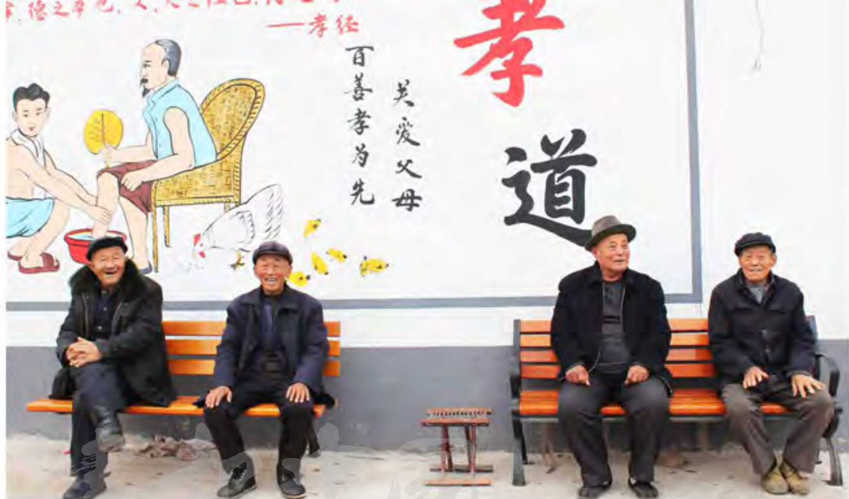
老人们的休息时光