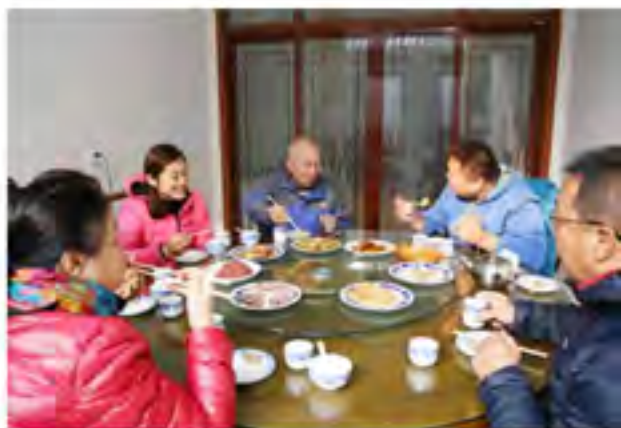
游客们品尝着当地菜肴“满家乐”风情餐