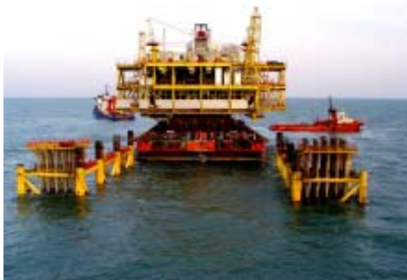
“浮托法”进行 NB35-2CEP 组块海上安装

并获得成功。NB35-2 油田开发工程 CEP 组块重达 7200 余吨，该组块海上安装首次采用“浮托法”（FLOATOVER），公司对该工程给予高度重视。经周密安排，精心策划，在“五一”长假期间（5 月 2 日），抓住有利时机，顺利以“浮托法”完成安装。她的成功，开创了中国海