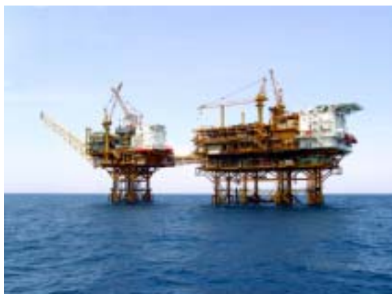
春晓 CEP 和天外天平台

此外，报告期还有几项工程顺利完工，获得了国内外业主的高度评价，证明了自身的能力和实力：