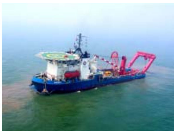
海洋石油 299 号船正在铺设海底电缆

1、加强设备维护。为保证完成全年作业任务，使设备处于良好作业状态，报告期内对主力工程作业船舶“蓝疆”号、滨海108等进行了修理。3月20日“蓝疆”号按计划完成了自投入运营以来的最大一次维修，随后即刻投入施工，使生产作业与设备维护相互协调，为后续作业提供了有力保障。